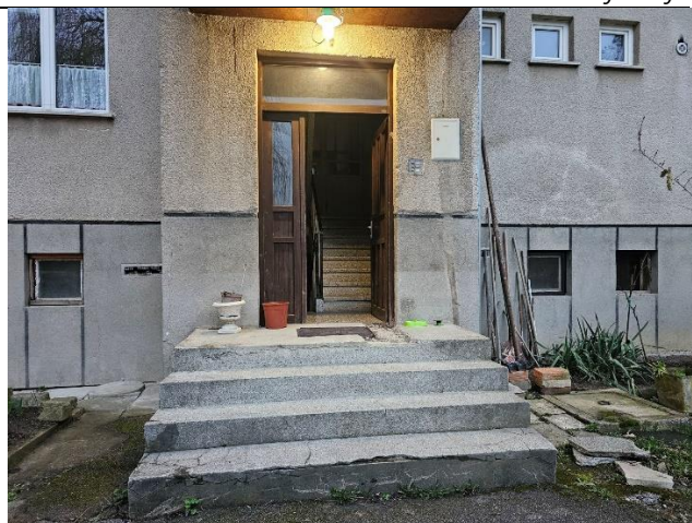
Slika 13: Objekt Pečovnik 55