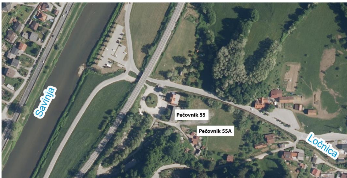
Slika 2: Prikaz lege objektov na območju Pečovnika

Objekt Pečovnik 55 se nahaja vzhodno od železniške proge Celje – Laško nad sotočjem Savinje in potoka Ločnica.