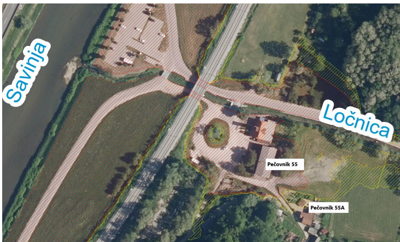
Slika 11: KRPN objekta Pečovnik 55