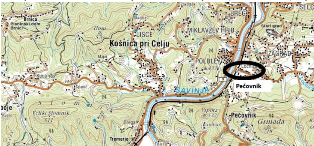
Slika 1: Obravnavano območje Pečovnik

Območja obravnave so tri različne lokacije v Mestni Občini Celje, ki so prikazane na sliki spodaj.