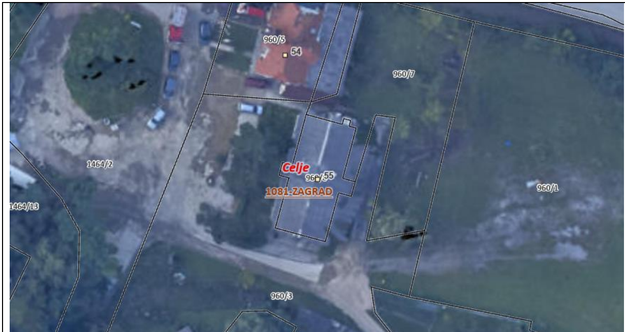
Fotografija 1: Ortofoto takoj po poplavih avgusta