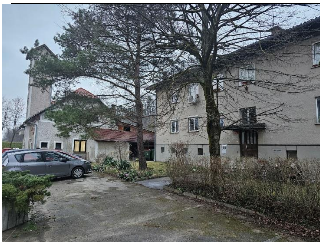
Slika 12: Objekt Pečovnik 55