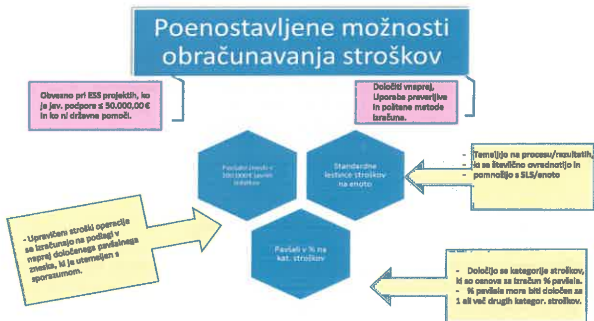
Slika 1: Prikaz poenostavljenih možnosti obračunavanja stroškov

Upravičeni stroški operacije so načeloma v obliki dejansko nastalih stroškov (vključno s prispevki v naravi in obračunom amortizacije). Možno pa je uporabiti tri poenostavljene oblike obračunavanja stroškov, kot jih prikazuje spodnja slika. Uporaba ene izmed poenostavljenih oblik je obvezna pri operacijah, ki so financirane iz sredstev ESS in ko je javna podpora operacije ≤ 50.000,00 € in ko operacija ni predmet državnih pomoči. Poenostavljene oblike obračuna upravičenih stroškov operacije je potrebno določiti vnaprej in pri tem uporabiti preverljivo in pošteno metodo izračuna.