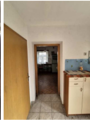
Objekt št. 104