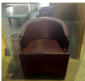
id 500871 * 2 kos

Id 501457; 501456; 501455 + en brez oznake ter steklena mizica 011-6