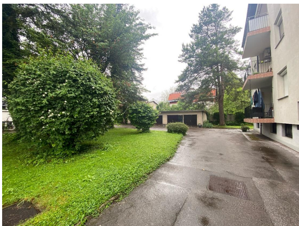
Slika 4: DOSTOP DO GARAŽ.