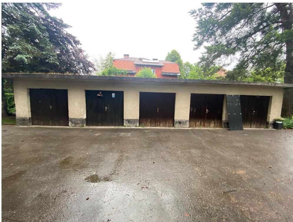
Slika 2: NIZ PETIH GARAŽ NA DVORIŠČU VEČSTANOVANJSKE STAVBE NA NASLOVU LEPI POT 14B, OD LEVE PROTI DESNI 2679-1501-1, 2679-1501-2, 2679-1501-3, 2679-1501-4 IN 2679-1501-5.