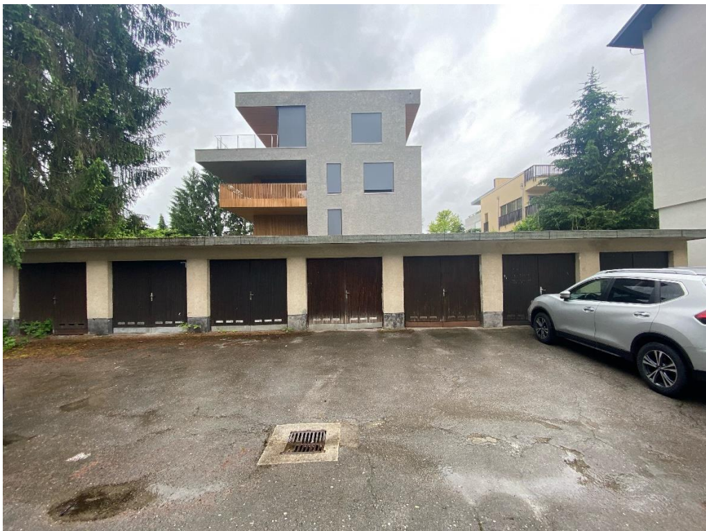
Slika 1: NIZ SEDMIH GARAŽ NA DVORIŠČU VEČSTANOVANJSKE STAVBE NA NASLOVU LEPI POT 14C, OD LEVE PROTI DESNI 2679-1500-1, 2679-1500-2, 2679-1500-3, 2679-1500-4, 2679-1500-5, 2679-1500-6 IN 2679-1500-7.