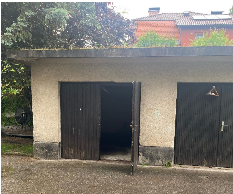
Slika 3: POSAMEZNA GARAŽA.