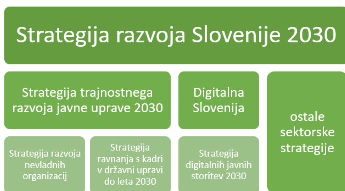
Slika 1: Njadreženost strateških dokumentov

Umestitev STRJU 2030 med razvojne dokumente je razvidna iz slike 1.