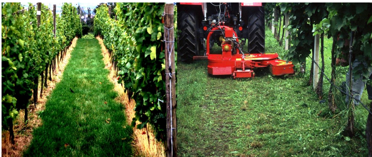
Slika 6: Zatiranje plevelov z uporabo herbicidov v vrsti pod trsi (levo) in mehansko zatiranje plevelov z odmičnim mulčerjem

Oskrba tal v vrsti je usmerjena v zaviranje razvoja močno rastočih plevelov in trav. Cilj oskrbe je usmerjanje razvoja plevelov in trav in ne uničevanje zelenega pokrova, zato se mora herbicid vedno aplicirati samo na rastline in ne na gola tla. Z na hitro odmrli rastlinskimi deli se poveča količina organske snovi, kar zmanjša negativne učinke herbicidov na življenje v tleh. Uporabimo lahko le herbicide, ki so navedeni v smernicah za integrirano varstvo vinogradov.