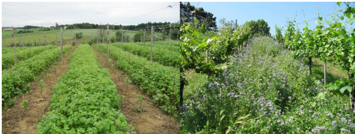
Slika 3 Zaščita tal pred erozijo in obogatitev tal z organsko snovjo s setvijo podorin. Na sliki levo ajda v mladem vinogradu, desno facelija v starem vinogradu.

rastlinsko maso pograbi z brežin v medvrstni prostor ali pod trte. Z načrtnim rahljanjem tal (groba obdelava) od zadnje dekade aprila do prve dekade maja pospešimo mineralizacijo dušika, da je trti na voljo do cvetenja in v juliju za rast mladik in jagod.