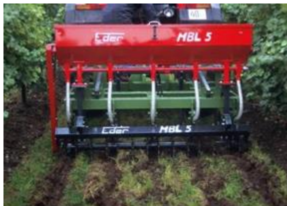
Slika 4: Grobo rahljanje tal oskrbovanih z negovano ledino in dodajanje gnojil z »odlagalcem« za izboljšanje založenosti tal s hranili v drugem horizontu tal

Za razliko od dušika, gnojenje s fosforjem in kalijem ni vezano na določen čas. Glede na njuno slabo gibljivost v tleh jih je najprimerneje dodati v jeseni, čeprav je največja poraba hranil spomladi, po brstenju, med intenzivno rastjo mladik. Pri ozelenitvi moramo gnojila raztrositi po celi površini. Vnos hranil v nižje plasti tal opravijo tudi rastline za zeleno gnojenje. V primerih, ko je v rodnih vinogradih zgornji horizont (0 do 25 cm) dobro založen s hranili spodnji (25 do 50 cm) pa slabo, ne moremo premešati tal, predvsem ne na večjih strminah. V taki situaciji lahko uporabimo stroje, s katerimi dodamo gnojila na želeno globino (slika 2). Da omogočimo regeneracijo ob tem poškodovanih korenin, tega ukrepa ne smemo izvajati v času glavne rasti trte. Primeren čas za to je od oktobra do novembra in od marca do maja. Dognovanje mora biti izvedeno na tak način, da se čim prej regenerira tudi travna ruša.