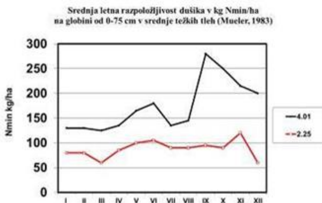
Slika 2: Prikaz srednje letne razpoložljivosti dušika v kg/ha v srednje težkih tleh glede na odstotek organske snovi v tleh

Ponudbo dušika lahko v veliki meri uravnavamo tudi z ustrežno oskrbo tal. To pomeni, da v času manjših potreb vinske trte po dušiku z ozelenitvijo zmanjšamo izgube dušika iz padavin in mineralizacije z ozelenitvijo. Ko pa nastopijo večje potrebe po dušiku, pa konkurenco podrasti zmanjšamo na minimum z mulčenjem, spomladi celo v kombinaciji z grobim rahljanjem. Na ta način so izgube dušika manjše, ponudba dušika pa prilagojena potrebam vinske trte. Zato se pri pomanjkanju dušika v tleh najprej vpeljejo ukrepi za povečanje organske snovi v tleh. To so setev rastlin za kratkotrajno ozelenitev tal (podorine, slika 1) in rastlin za trajno ozelenitev ter pokrivanje tal (zastiranje) z organsko snovjo (slama).