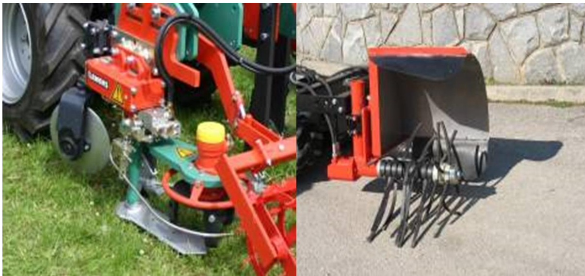
Slika 5: Podrezovalnik plevelov (slika levo) in prirejen pletvenik (slika desno) za mehansko zatiranje plevelov v vrsti