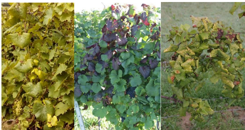
Slika 7: Splošna bledikavost, rumenenje listov pri belih sortah, rdečenje pri rdečih sortah, zvijanje listnih robov navzdol.

Imetniki vinogradov naj pozorno pregledujejo vinograde v času po cvetenju trte, predvsem pa v juliju, avgustu in septembru. V primeru suma je treba poklicati lokalnega fitosanitarnega inšpektorja ali strokovnjaka za varstvo rastlin na lokalnem kmetijsko gozdarskem zavodu ali inštitutu ali UVHVVR. Pozornost je potrebna predvsem v primeru, če se v vinogradu povečuje število simptomatičnih trt!