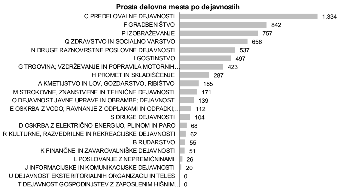
Slika 1: Objavljena prosta delovna mesta na OS M. Sobota v letu 2019

Med temi je bilo največ povpraševanja v naslednjih dejavnostih: