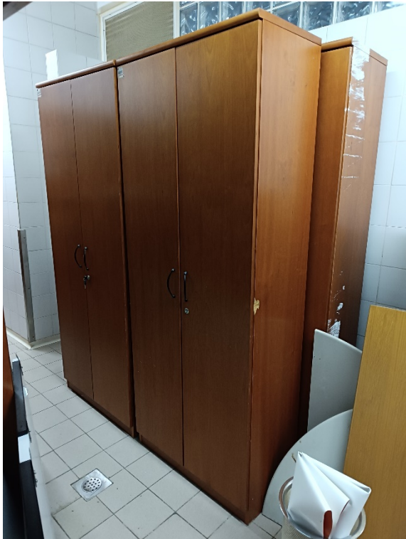
Fotografija (levo): točka št. 10;