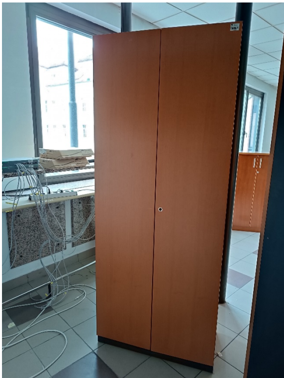
Fotografija (levo): točka št. 6;