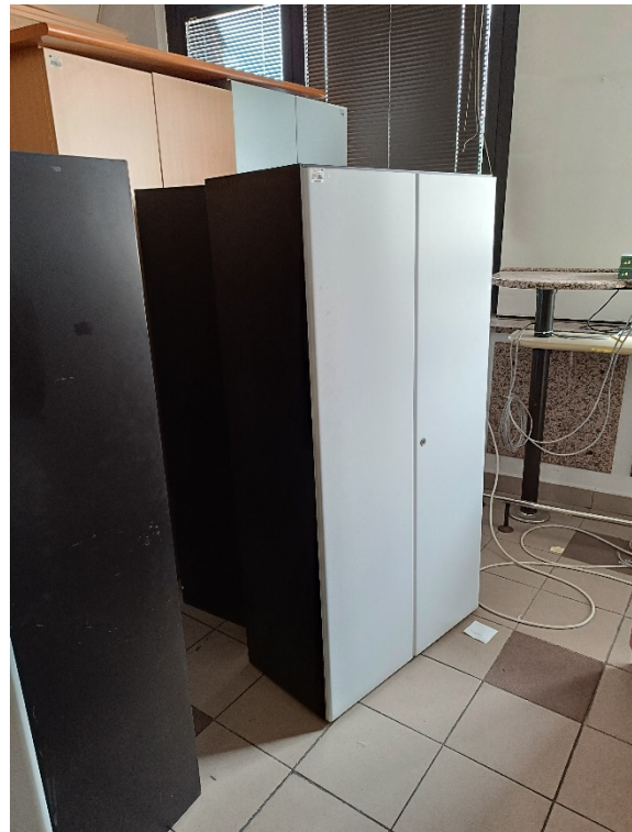
Fotografija (levo): točka št.1 - levo, točka št. 2 in št. 3 – desno; Fotografija (desno): točka št.7;