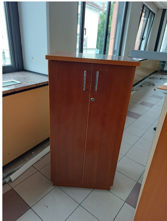
Fotografija (desno): točka št. 5;