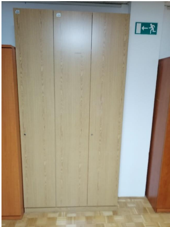
Točka št. 3 in 4