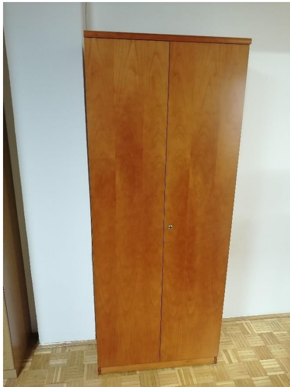
Točka št. 6