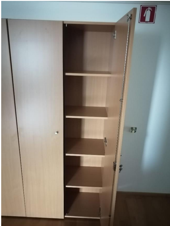
Točka št. 1

Ministrstvo za kohezijo in regionalni razvoj ne prevzema nobene odgovornosti za točnost navedenih podatkov. Zgoraj zapisane mere oziroma dimenzije pisarniškega pohištva so informativne narave, saj so možna odstopanja od dejanskih navedenih vrednosti. Barva, material in stanje posameznega pisarniškega pohištva je razvideno iz fotografij. Ključavnice so v večini primerov poškodovane oziroma ne opravljajo svoje prvotne funkcije.