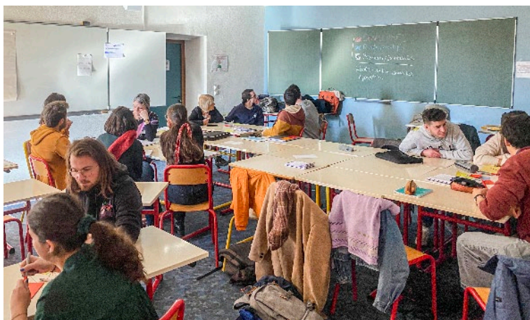
..... Reflections and discussions in small groups, France, Fotografija: Natael Fautrat. .....

Mladi so bili ne glede na starost in bivalne prostore zaskrbljeni zaradi življenjskih stroškov; bodisi za hrano, nastanitev ali cene pristočasnih dejavnosti. V gorskih območjih, zlasti pa v turističnih krajih, se cene zvišujejo, kar vpliva zlasti na mlade, ki si ne morejo več privoščiti življenjskih stroškov. Poleg stroškov je velika težava tudi pomanjkanje storitev, na primer na področju zdravstvenega varstva in prevoza. Na kakovost življenja mladih v teh regijah vpliva pomanjkanje kulturnih dejavnosti (od prostorov za srečevanje mladih do kulturne ponudbe, kot so koncerti, kino itd.). Miselnost prebivalcev goratih območij in njihov pogosto nazadnjaški pristop vzbujata pomisleke v skupinah mladih, s katerimi smo se pogovarjali.