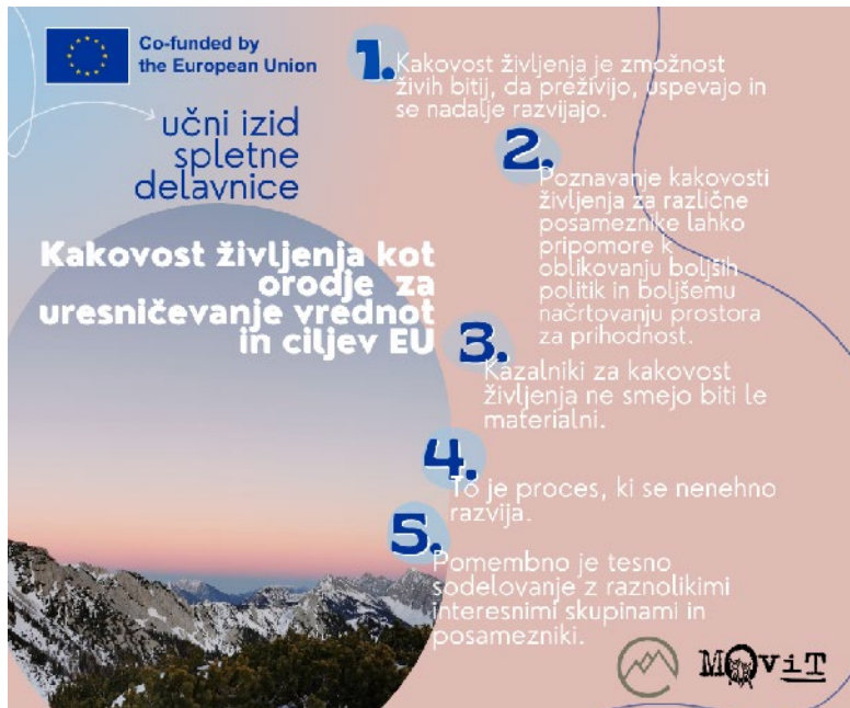
..... Slika 2: Učni rezultati spletnega seminarja »Kakovost življenja kot orodje za uresničevanje vrednot in ciljev EU«, Dijana Čataković .....