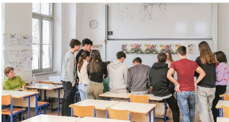
Udeleženci živega laboratorija v Idriji, Fotografija: Samo Kham.