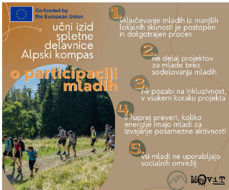
..... Slika 3: Učni rezultati spletnega seminarja o mladinski participaciji, Dijana Čataković .....

Delavnica je bila osredotočena na izboljšanje kakovosti življenja, zlasti na reševanje problematike odseljavanja mladih z oddaljenih alpskih območij. Predavatelji so razpravljali o strategijah za zagotavljanje trajnega vključevanja mladih, oblikovanju zanimivih in uravnoteženih dejavnosti ter vključujočem izvajanju politik.