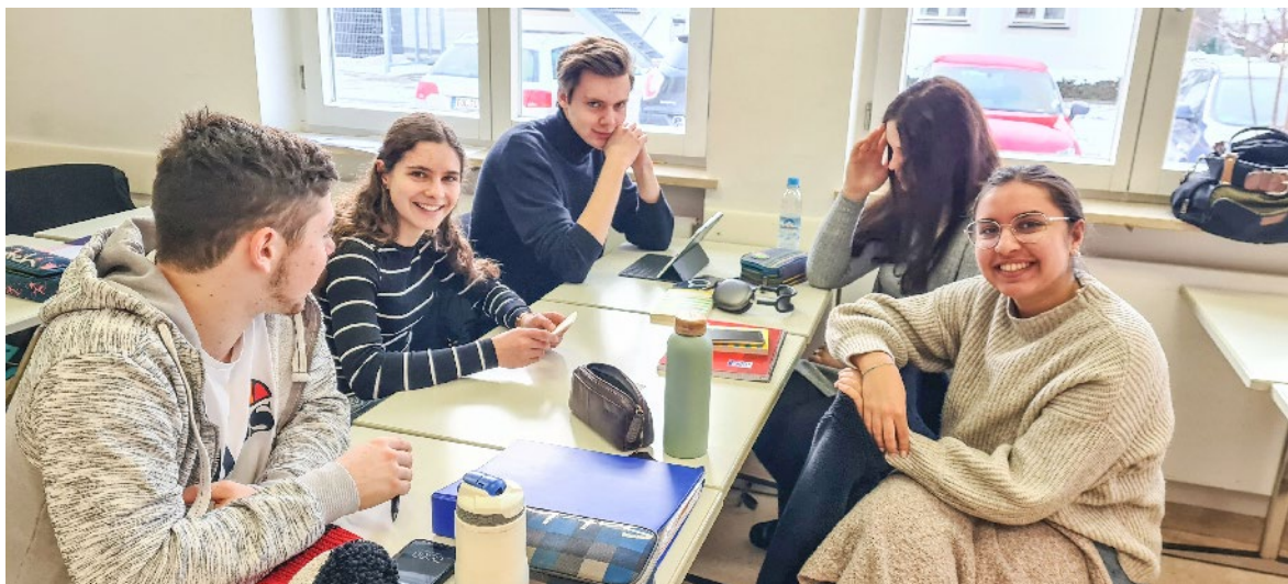
Udeleženci živega laboratorija v Bad Tölzu.