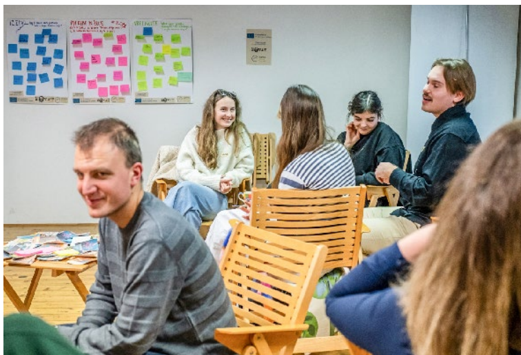
..... Opredelitev potreb, želja in izzivov, Slovenija. .....