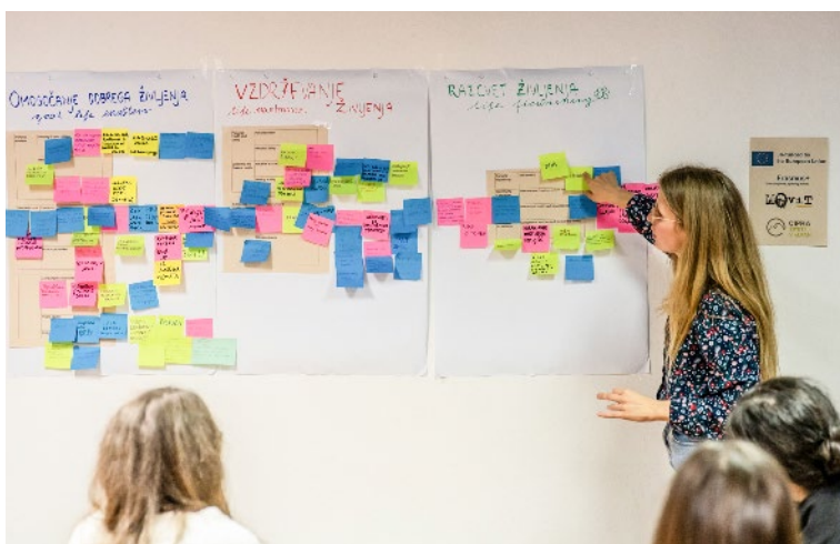
..... Razvrščanje napisanih potreb, želja in izzivov v izbrane kazalnike kakovosti življenja, Slovenija. .....