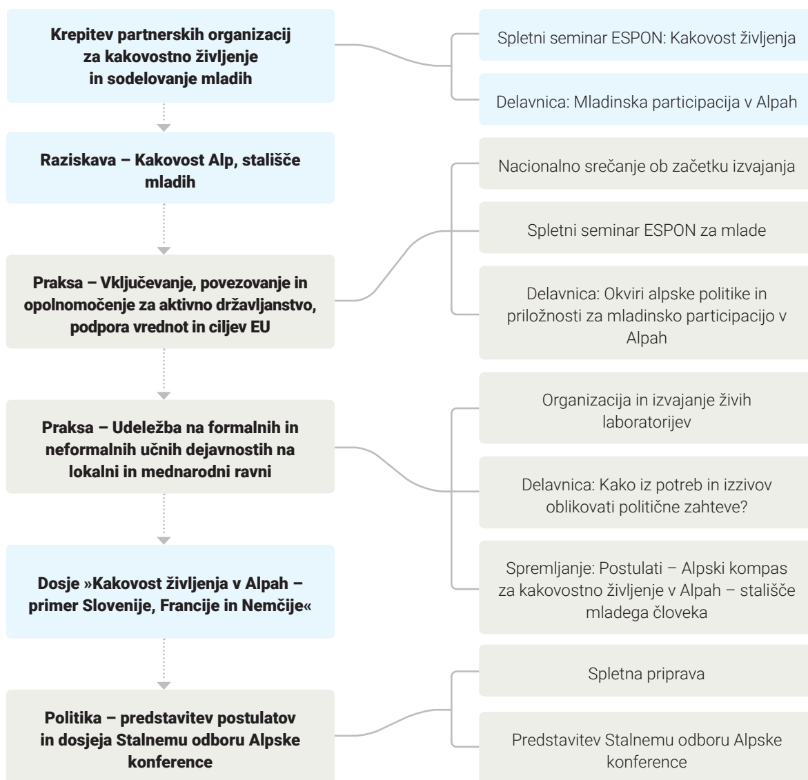
Slika 1: Časovnica projektnih dejavnosti, Katarina Žemlja