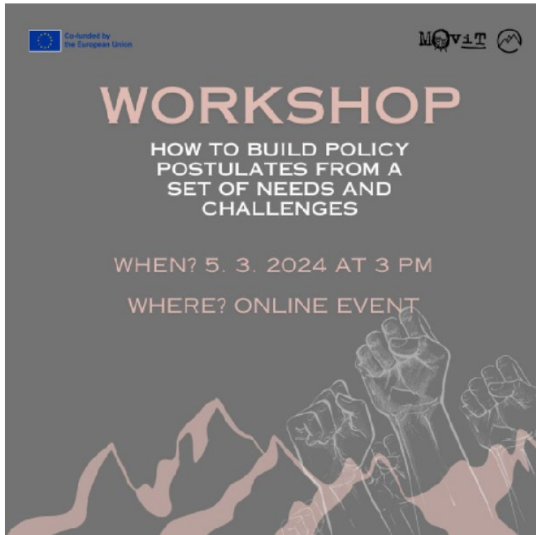
..... Slika 4: Delavnica o oblikovanju postulatov, Dijana Čatakovič. .....