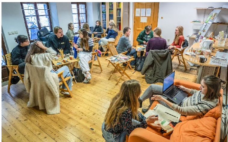
Udeleženci živega laboratorija v Ljubljani.

Na dveh delavnicah živega laboratorija v Sloveniji so mladi iz alpskega prostora razmišljali o kakovosti življenja, svojih izzivih, potrebah, željah in vrednotah. Kot vrednote so navedli dostop do narave, gora in zelenih površin, čist zrak in zemljo, obilico lokalnih kmetij in lokalno pridelane hrane, urejene pohodniške in kolesarske poti ter s tem možnost aktivnega preživljanja prostega časa.