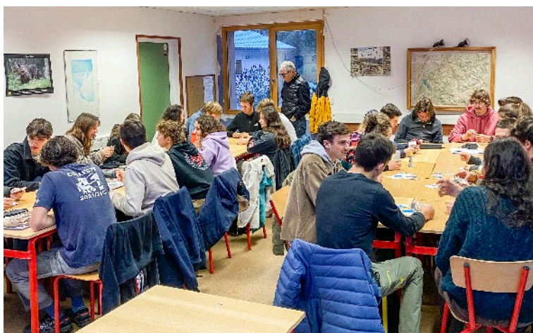
..... Študentje CFMM v Thônesu, Francija, Fotografija: Natael Fautrat. .....

MLADI FRANCOZI so v dveh živih laboratorijih razpravljali o ključnem vprašanju: »Kakšna je kakovost življenja na območju Alp?« Glavne vrednote, ki so bile pogosto omenjene, so bile povezanost z naravo, različne možnosti za aktivno življenje v gorskih območjih, kot so pohodništvo, smučanje, kolesarjenje itd., ter dostop do kakovostnih storitev, na primer zdravstvenega varstva in trgovin, pa tudi dostopnost z javnim prevozom.