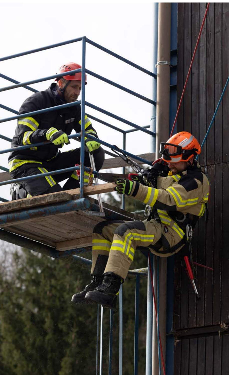
Aktivni spust z uporabo vrvne tehnike