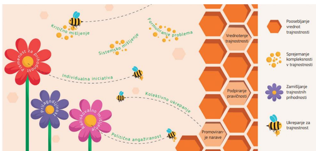
Vizualna predstavitev okvira GreenComp