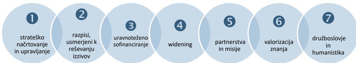
Grafika 1: shema sedmih tematskih področij ključnih priporočil