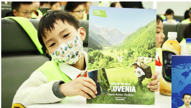
Udeleženec dogodka Little Diplomats Avtor: GK Šanghaj

V nadaljevanju so s svojimi umetniškimi predstavami in spretnostmi predstavili še lepoto kitajske kulture. Otroci se ob projektu poleg spoznavanja Slovenije urijo tudi v veščini javnega nastopanja in sodelovanja v večkulturnem okolju.