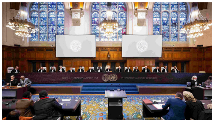
Meddržavno sodišče v Haagu

Sodišče bo svetovalno mnenje predvidoma izdalo letos in s tem postavilo pravni okvir za ukrepanje na področju vplivanja na podnebne spremembe. V primeru prepoznanja človekove pravice do zdravega, čistega in trajnostnega okolja bodo imeli posamezniki tudi večje možnosti, da od držav zahtevajo ustrezno ukrepanje. Koristno bo, če bo sodišče natančneje opredelilo obveznosti držav, ki izhajajo iz varovanja te človekove pravice – po mnenju Slovenije sta to nedvomno okrepljeno sodelovanje držav pri zmanjševanju negativnih vplivov na podnebje in tudi aktivno prizadevanje držav za njihovo zmanjšanje.