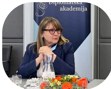
GS Barbara Žvokelj

Preden sem prevzela funkcijo, sem sedela v pisarni in brala »pravno podlago za delo«, torej razne zakone in podzakonske akte s področij, za katera je pristojen sekretariat. Potem pa pride september, prevzem funkcije in takoj na mizo padejo trije večji »izzivi«: novela Zakona o zunanjih zadevah (ZZZ-1) in proračun ter v tistem trenutku najhujše: Predlog zakona o spremembah in dopolnitvah Zakona o dohodnini.