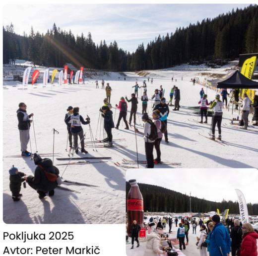
Pokljuka 2025