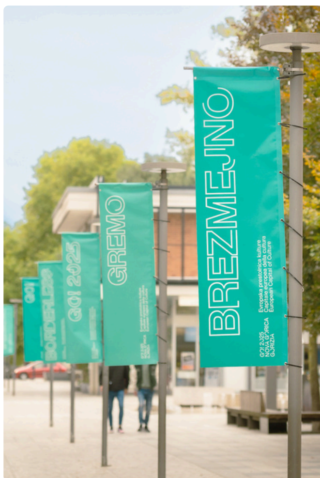
Avtor: Jernej Humar

A tu je še »peti element«, ki so ga poimenovali Cinecitta in ga boste v toplih poletnih večerih prepoznali na filmskih platnih, kjer se rada zgodi tista magija tkanja pogledov. Takrat boste vedeli, da ste prešli mejo. In šele takrat boste zaznali, zakaj je evropska prestolnica kulture resnično brezmejna.