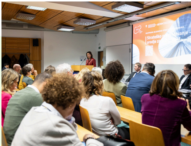
Razprava Strateško predvidevanje – orodje za prihodnost, Fakulteta za družbene vede, 20. februar 2025