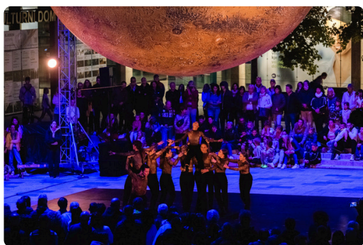
Slavnostno odprtje EPK 2025, Nova Gorica – Gorica

Evropska prestolnica kulture 2025 Nova Gorica – Gorica je odprta! Otvoritev je bila veličastna, v celodnevni živopisni povorki se je skozi obe mesti sprehodilo več kot dva tisoč nastopajočih in več kot 50 tisoč obiskovalcev. Na prenovljenem Trgu Evrope sta si predsednika Slovenije in Italije, Nataša Pirc Musar in Sergio Mattarella, segla v roke in naznanila uradno odprtje, župana obeh mest sta pritisnila na gumb in na trgu pred občinsko palačo v Novi Gorici se je lahko začel velik umetniški spektakel, o katerem bodo še dolgo govorili.