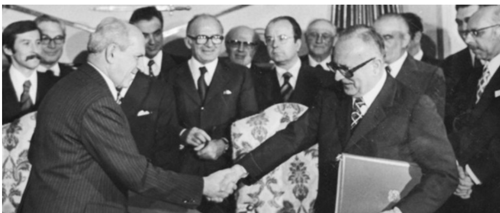
Podpis Osimskih sporazumov, Osimo, 10. november 1975

V diplomatski zgodovini Jugoslavije in s tem tudi današnje Slovenije, predstavljajo Osimski sporazumi iz leta 1975 enega ključnih diplomatskih in političnih dosežkov ter model, kako voditi diplomatska pogajanja. Sporazumi so bili podpisani v italijanskem mestecu Osimo novembra 1975, ratificirani pa dve leti pozneje.