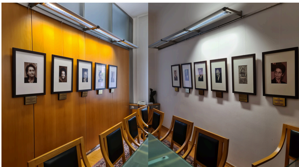
Mala sejna soba MZEU