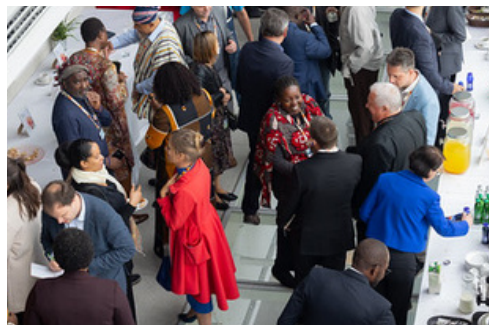
Mreženje udeležencev konference

Program, video posnetek in poročilo o letošnjem Dnevu Afrike so dostopni tu .