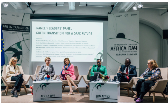
Panel voditeljev na Dnevu Afrike 2024

Namen dogodka, ki ga organizira Ministrstvo za zunanje in evropske zadeve, je poglobljanje političnega, gospodarskega, kulturnega in drugega sodelovanja med Slovenijo, Evropo in Afriko ter krepitev partnerstva, ki temelji na obojestranskem spoštovanju in zaupanju. To je pomembno vodilo pri organizaciji razprav. Prizadevamo si namreč, da bi Slovenija, Evropa in Afrika o globalnih izzivih razpravljale kot enakovredne partnerice.