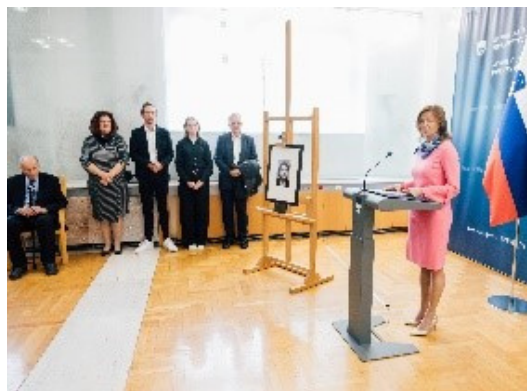
Nagovor ministric Tanje Fajon na letošnji slovesnosti