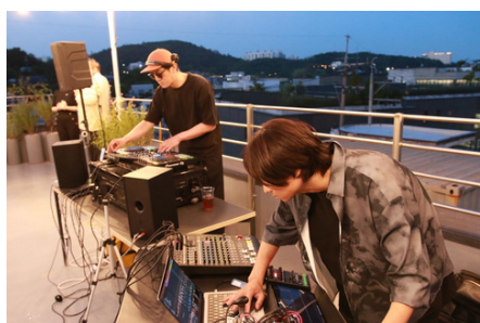
Glasbeni performans

Rezultate diplomatskih sprejemov in srečanj je velikokrat težko ovrednotiti glede kakovosti, še težje pa s številkami. Pa vendar nas atmosfera ter izjemno pozitivni odzivi gostov in medijev navdajajo z občutkom, da je bil dogodek uspešen, da je še okrepil podobo Slovenije – sicer majhne, a aktivne, prodorne in odgovorne države