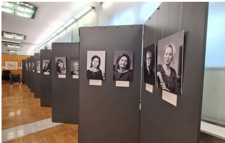
Fotografska razstava (avtor Jernej Jelen) "Vplivne Slovenke brez ličil"