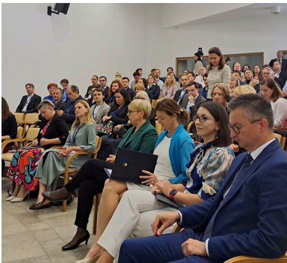
PR RS Musar, ministri Fajon, Stojmenova Duh in Šarec

Druga nacionalna konferenca o UI (prvo smo organizirali lani novembra, prav tako na gradu Jable) je bila namenjena pregledu in izvajanju možnih rešitev za uvajanje sistemov UI, ki bodo koristili gospodarstvu, javni upravi, diplomaciji, krepitvi mednarodnega sodelovanja in povezovanju med vsemi ključnimi deležniki v Sloveniji. Nenazadnje pa tudi iskanju priložnosti, ki jih umetna inteligenca prinaša za mednarodno prepoznavnost Slovenije.