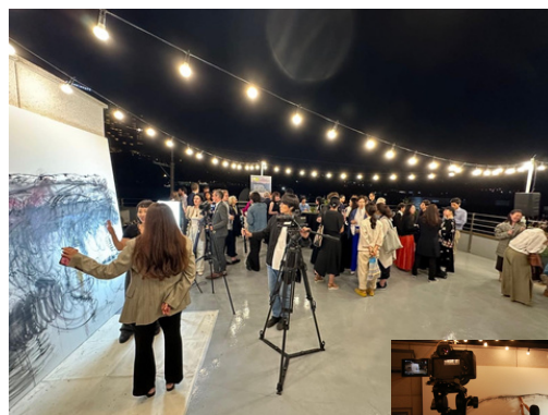
Likovno ustvarjanje na platnu Avtor: Veleposlaništvo Seul

V sodelovanju s priznanima korejskima glasbeno-vizualnima umetnikoma je ideja rasla, se razvijala in se na koncu na strehi veleposlaništva udeležila v izvedbi umetniško-kontemplacijskega performansa Sounds of Bees on Canvas . Šlo je za preplet zvočnih dražljajev, vključno z umetniško modifikacijo zvoka čebel v panju, in sočasnega ustvarjanja likovnega dela na velikem platnu. In najpomembnejše, šlo je za dogodek, ki je v želji spodbuditi razmislek o pomenu ohranjanja čebel in trajnostnega razvoja našega planeta povezal različne sfere družbe, ki se, vsaj v Seulu, redko zberejo na enem mestu – umetnost in umetnike je povezal s politiko, diplomacijo, gospodarstvom ter z znanostjo in čebelarstvom.