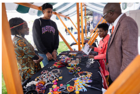
Predstavitve veleposlaništev

Kljub bistveno skromnejšemu proračunu v primerjavi z lanskim letom nam je uspelo izvesti kakovostno konferenco z visokimi in zanimivimi gosti iz mnogih afriških in evropskih držav ter pripraviti izvrsten kulturni in spremljevalni program. Našteli smo 180 udeležencev iz 38 držav. Vedno večji interes, ki ga za udeležbo na dogodku izkazuje slovenska in tuja publika, vključno s številnimi afriškimi veleposlaništvimi, je zelo dobra popotnica za nadaljnji razvoj Dneva Afrike.