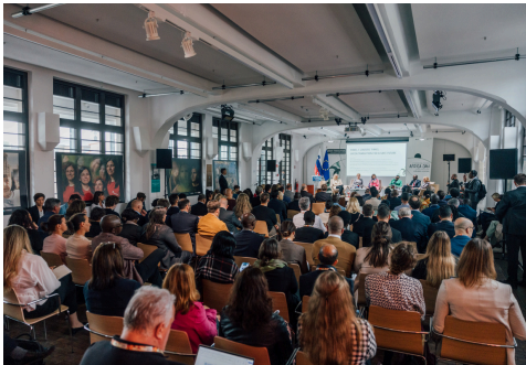
Polna dvorana v Centru Rog