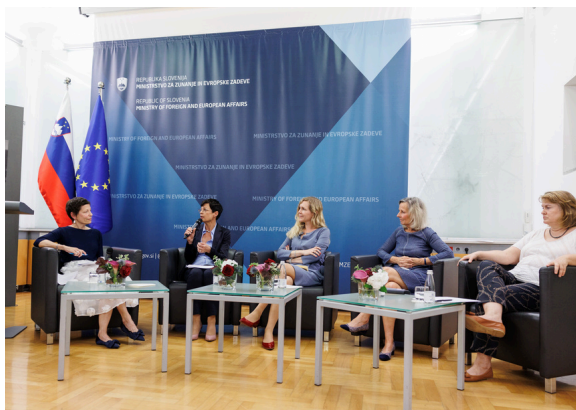
Panelistke Stadler Repnik (moderatorka), Kos, Kauther, Levy, Tomič

24. junij je svetovni dan žensk v diplomaciji. A vredno se je vprašati, zakaj ga zaznamujemo. Ali je ta dan slavospev diplomatkam in njihovem prispevku v mednarodnih odnosih? Ali gre za opomnik, da takšen dan moramo imeti, da z njim opominjamo na razlike oziroma neenakosti med diplomatkami in diplomati?