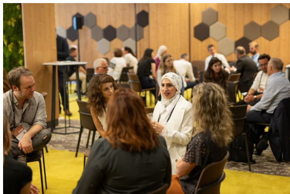
"Fishbowl" razprave

Interaktivna »živa knjižnica« je bila še ena inovacija letošnjega foruma. Udeležencem je omogočila neposredne in osebne pogovore z ljudmi, ki so delili svoje izkušnje o migraciji, begu in integraciji. Med »knjigami« oziroma govorniki so bili posamezniki iz različnih okolij – od ljudi, ki so preživeli vojno in begunsko pot, do strokovnjakov, ki se ukvarjajo z migracijskimi politikami na globalni ravni. Ta edinstvena oblika razprav je udeležencem omogočila, da so pridobili neposreden vpogled v izzive in težave, s katerimi se soočajo migranti, pa tudi v kompleksnost vodenja migracijske politike.