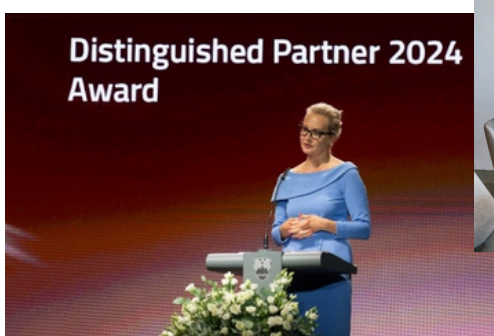
Govor Julije Navalne ob prevzemu nagrade

V uvodnem delu prvega dne je bila podeljena tudi nagrada ugledne partnerice Blejskega strateškega foruma (»Distinguished Partner Award«) , ki jo je iz rok predsednika slovenske vlade Roberta Goloba in v priznanje za svoje delo na področju človekovih pravic in boja proti avtoritarizmu v Rusiji prejela Julija Navalna. V govoru je poudarila, kako pomembno je, da mednarodna skupnost nadaljuje z učinkovitim pritiskom na režime, ki kršijo človekove pravice, in poudarila potrebo po skupni strategiji, ki bi pripeljala Rusijo nazaj na pot demokratičnega razvoja. Opozorila je na pomen mednarodnega sodelovanja in solidarnosti pri spopadanju s politično represijo in neenakostjo, kar ostaja ključno za zaščito temeljnih pravic in svoboščin po vsem svetu.