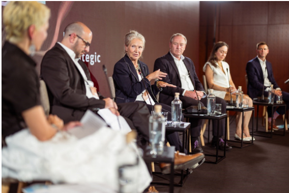
Panelna razprava "Preparing for Unknown Futures"

Drugi dan foruma je bil namenjen vprašanjem sprave, geopolitičnim varnostnim izzivom, krepitvi odpornosti za neznano prihodnost, boju proti dezinformacijam, energetski in vodni varnosti, zelenemu prehodu, podnebnim spremembam in migracijam. Tradicionalno je potekal tudi panel o turizmu.