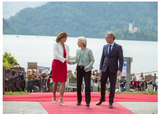
Od leve proti desni ministrica za zunanje in evropske zadeve Tanja Fajon, predsednica Evropske komisije Ursula von der Leyen, predsednik vlade Robert Golob