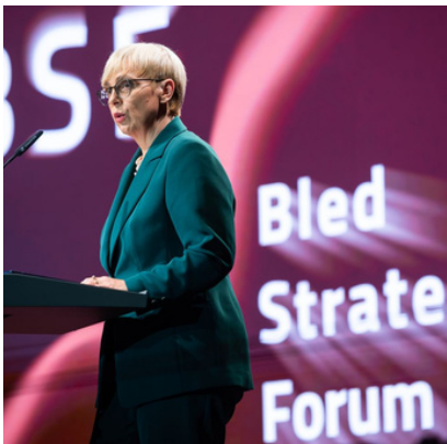
Nagovor predsednice države Nataše Pirc Musar

Dotaknila se je slovenskega predsedovanja Varnostnemu svetu Organizacije združenih narodov (OZN) in načel, ki jih bomo kot država zagovarjali, vključno z iskanjem poti iz bližnjevzhodnega konflikta. »Delali bomo kljub občutku nemoči, tudi ko bo veto izglasovan. In če bomo med razpravo slišali 'WCNSF', se bomo še bolj potrudili,« je dejala ob uveljavitvi nove uradne kratic v zdravstvenem besedišču Gaze in razložila njen pomen: »WCNSF stands for Wounded Child, No Surviving Family,« (prevod: ranjen otrok, brez preživele družine) – to vzbuja občutek obupa. »Najmanjši skupni imenovalec svetovnega reda je lahko samo en – mir,« je nagovor sklenila ministrica Fajon.