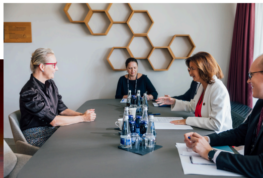
V pogovoru z ministrico Fajon