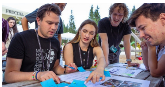
Udeleženci Blejskega strateškega foruma za mlade na Pokljuki

Razpravi sta primer nekoliko drugačnega pristopa Blejskega strateškega foruma za mlade, ki v ospredje postavlja poglobljen premislek z manjšim številom gostov in večjo vključenostjo poslušalcev. Na enakem pristopu je temeljil tudi osrednji del foruma za mlade, ki je letos potekal na Pokljuki. Tam se je 42 mladih strokovnjakinj in strokovnjakov iz 30 držav zbralo z namenom, da bi raziskali, kaj stoji za drobitvijo dojemanja družbenih resničnosti in kako jih ponovno zblížati.