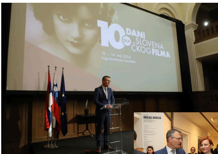
Odprtje 10. dnevov slovenskega filma