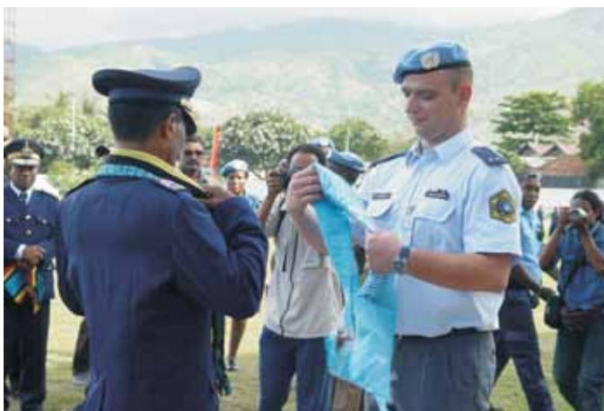
Arhiv Ministrstvo za notranje zadeve (MNZ) – Policija

2. RS s strategijo sodelovanja v mednarodnih operacijah in misijah določa okvire za odločanje o sodelovanju ter opredeljuje splošen nabor zmogljivosti za njeno izvajanje. Strategija je usklajena z ostalimi ključnimi dokumenti, ki urejajo področje nacionalne varnosti, zunanje politike, vključno z razvojnim sodelovanjem, drugimi strateškimi dokumenti in relevantnimi zakonodajnimi akti. Strategija vzpostavlja pogoje za ustrezno definiranje strateških in izvedbenih ciljev, krepitev analitične podpore pri odločanju, povečanje prožnosti, krepitev koordinacije za doseganje celovitega pristopa in sinergij, doseganje multiplikativnih učinkov in za skrajšanje odzivnega časa.