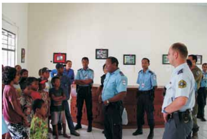
Arhiv MNZ – Policija

14. Temeljna načela in vrednote, iz katerih izhaja interes za sodelovanje RS v mednarodnih operacijah in misijah, so krepitev mednarodne varnosti, demokracije, spoštovanje človekovih pravic in temeljnih svoboščin, zaščita posebej ranljivih skupin, kot so otroci in ženske, vladavina prava, učinkoviti multilateralizem, odgovornost in solidarnost, spoštovanje mednarodnega prava, sodelovanje na osnovi enakopravnosti ter zagotavljanje enakih možnosti. Pri načrtovanju sodelovanja v mednarodnih operacijah in misijah se upošteva smiselnost povezovanja varnostnih s humanitarnimi in razvojnimi aktivnostmi ter z aktivnostmi v podporo človekovih pravic in svoboščin.