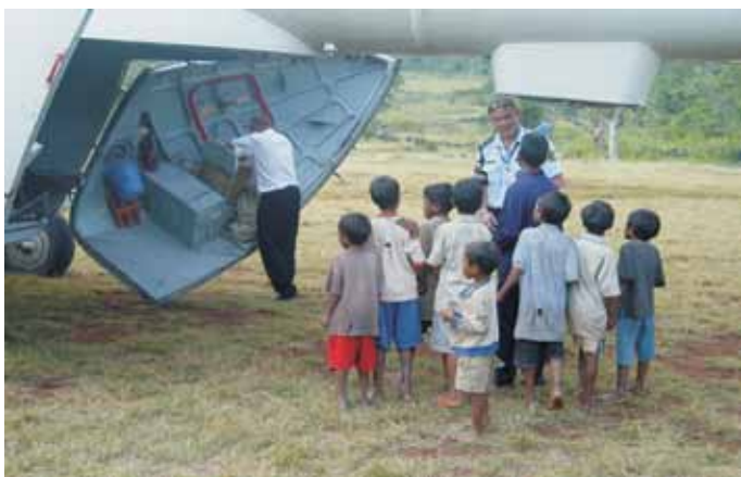
Arhiv MNZ – Policija

13. Strategija sodelovanja RS v mednarodnih operacijah in misijah predstavlja odziv na spremembe varnostnega okolja in novih globalnih izzivov, ki jih podrobneje opredeljujejo Resolucija o strategiji nacionalne varnosti RS, Strategija slovenske zunanje politike, Strategije javne varnosti, Resolucija o mednarodnem razvojnem sodelovanju RS za obdobje do leta 2015 ter Resolucija o nacionalnem programu varstva pred naravnimi in drugimi nesrečami v letih 2009–2015. Nastale spremembe zahtevajo razvoj celovitega nabora mehanizmov in aktivno sodelovanje v skupnih prizadevanjih mednarodne skupnosti za preprečevanje, obvladovanje in reševanje konfliktov, pokonfliktno obnovo na globalnem nivoju in pomoč ob naravnih in drugih nesrečah.