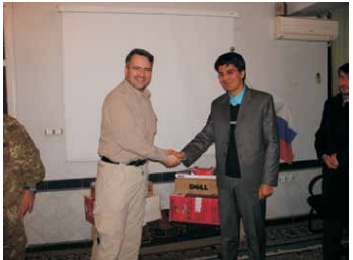
Arhiv Ministrstvo za zunanje zadeve (MZZ)

4. RS se zaveda pomena sodelovanja v mednarodnih operacijah in misijah s ciljem zagotavljanja mednarodnega miru in varnosti, stabilnosti, demokracije, razvoja, krepitve vladavine prava, človekovih pravic in temeljnih svoboščin ter nudenja pomoči ob naravnih in drugih nesrečah. Kot aktivna in odgovorna članica mednarodne skupnosti s sodelovanjem prispeva k solidarnosti in humanosti do prizadetega prebivalstva ter k stabilizaciji kriznih žarišč, od koder bi se lahko grožnje miru razširile tudi na druge države in regije, s tem pa zagotavlja tudi lastno varnost.