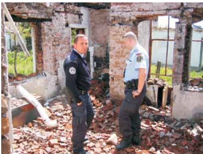
Arhiv MNZ – Policija

5. Aktivna udeležba RS v mednarodnih operacijah in misijah je sestavni del celovitega pristopa k zagotavljanju nacionalne varnosti in blaginje, uresničevanju zunanjepolitičnih, varnostnih, gospodarskih, razvojnih in drugih interesov in ciljev ter k izpolnjevanju obveznosti in izkazovanju solidarnosti v multilateralnem in bilateralnem okvirju. Jasna strategija sodelovanja v mednarodnih operacijah in misijah, strokovnost, usposobljenost in celovitost pristopa bo pripomogla k boljši mednarodni podobi in položaju ter krepitvi ugleda in verodostojnosti RS. Poleg tega je sodelovanje v mednarodnih operacijah in misijah izrednega pomena za RS tudi zaradi pridobivanja pomembnih izkušenj. RS tako na učinkovit način zagotavlja uveljavljanje strateških interesov države.