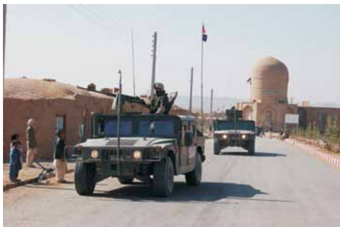
Arhiv MO RS

43. Postopke za sodelovanje se izvaja na način, da so v čim krajšem času na voljo podlage za odločanje in aktivno sodelovanje v mednarodnih operacijah in misijah. Za doseganje zastavljenih ciljev je potrebno stalno in sistematično vzdrževanje ustreznega nivoja pripravljenosti in razpoložljivosti enot in pripadnikov Slovenske vojske ter Policije, civilnih strokovnjakov in zmogljivosti na obrambnem področju, zmogljivosti za zaščito, reševanje in pomoč ter vzdrževanje seznama pripravljenih in razpoložljivih civilnih izvedencev na način, da so lahko v čim krajšem času napoteni v mednarodne operacije in misije. Slednje mora vključevati tudi zagotovitev ustreznih finančnih in materialnih pogojev oziroma zmogljivosti.