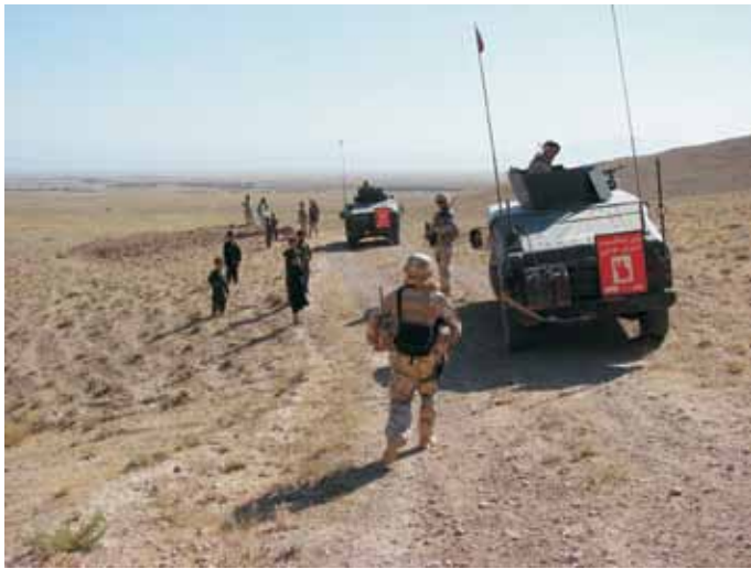
Arhiv MO RS – Poveljstvo sil SV

5. Aktivna udeležba RS v mednarodnih operacijah in misijah je sestavni del celovitega pristopa k zagotavljanju nacionalne varnosti in blaginje, uresničevanju zunanjepolitičnih, varnostnih, gospodarskih, razvojnih in drugih interesov in ciljev ter k izpolnjevanju obveznosti in izkazovanju solidarnosti v multilateralnem in bilateralnem okvirju. Jasna strategija sodelovanja v mednarodnih operacijah in misijah, strokovnost, usposobljenost in celovitost pristopa bo pripomogla k boljši mednarodni podobi in položaju ter krepitvi ugleda in verodostojnosti RS. Poleg tega je sodelovanje v mednarodnih operacijah in misijah izrednega pomena za RS tudi zaradi pridobivanja pomembnih izkušenj. RS tako na učinkovit način zagotavlja uveljavljanje strateških interesov države.