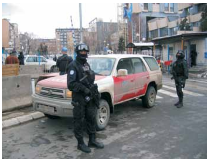
Arhiv MNZ – Policija

36. V okviru načrtovanja, priprav in izvajanja sodelovanja RS v mednarodnih operacijah in misijah se ustrezno ovrednotijo tudi možnosti za sodelovanje slovenskega gospodarstva pri logistični oskrbi posamezne operacije oziroma misije in za pridobitev poslov, vezanih na pokonfliktno obnovo prizadetega območja. O potencialnih poslovnih možnostih se skozi vse obdobje načrtovanja, priprav in izvajanja sodelovanja RS v mednarodnih operacijah in misijah ažurno in na primeren način obvešča slovensko gospodarstvo.