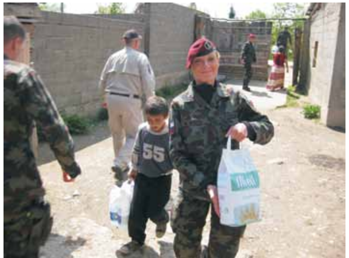
Arhiv MO RS

31. Vlada RS zagotovi zmogljivosti z ustreznim načrtovanjem, ki vključuje koordinacijo med vladnimi in nevladnimi akterji, vključno z nevladnimi oziroma civilno družbenimi organizacijami, strokovnimi združenji, vsemi razpoložljivimi, vključno z upokojenimi strokovnjaki, gospodarstvom in javnimi mediji. Pri tem poskrbi tudi za razvoj pozitivnih vzpodbud in osveščanja in, po potrebi, z ustrezno prilagoditvijo pravnega okvirja, vključno s pripravo nacionalnega načrta za povečanje vloge žensk pri zagotavljanju miru in varnosti, skladno z resolucijama VS OZN 1325 in 1820. Sodelujočim v mednarodnih operacijah in misijah se zagotovi ustrezne motivacijske dejavnike. Prav tako se poenoti pristop glede rizikov in zavarovanj za sodelujoče osebje v mednarodnih operacijah in misijah in glede materialno-tehničnih sredstev.