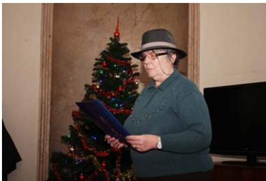
Fotografija Ob leu o soorej 2013

Infomedia3Filming, Viba film Ljubljana, 1976, 35 mm, barvni, zvočni, 11', scenarist Ivan Nemanič, režiser Milan Ljubič, snemalec Jure Pervanje