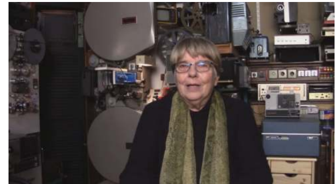
Fotografija: posnetek o špici SFA