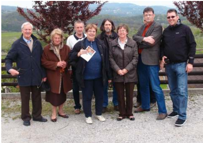
Fotografija sodelavci Slovenski filmski arhiv 2012, vir Arhiv RS