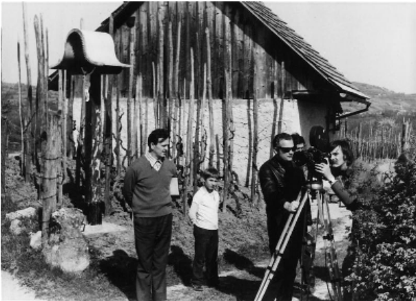
Fotografija iz filma Soseka