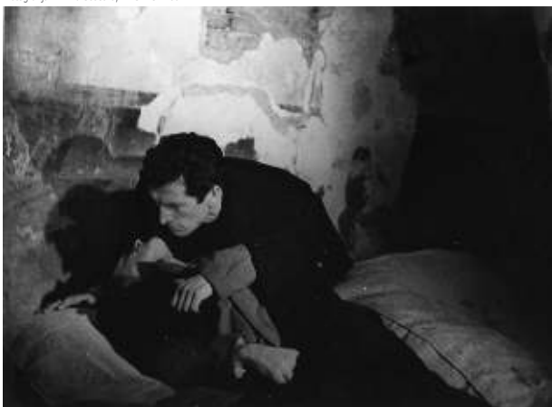
Fotografija iz filma Podobe iz sanj