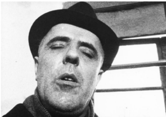
Fotografija iz filma Cukrartna