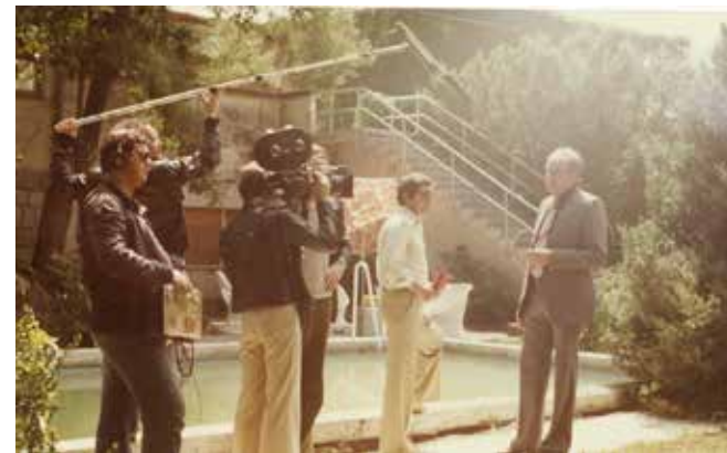
Fotografija iz filma Prestop

Viba film Ljubljana, 1980, 35 mm, barvni, zvočni, 92', literarna predloga Človekova koža, scenarista Mirče Sušmel, Matjaž Zajec, režiser Matija Milčinski, direktor fotografije Valentin Perko