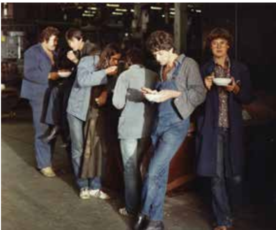
Fotografija iz filma Prestop

Večer Slovenskega filmskega arhiva pri Arhivu Republike Slovenije