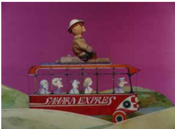
Fotografija iz filma Fatamorgana