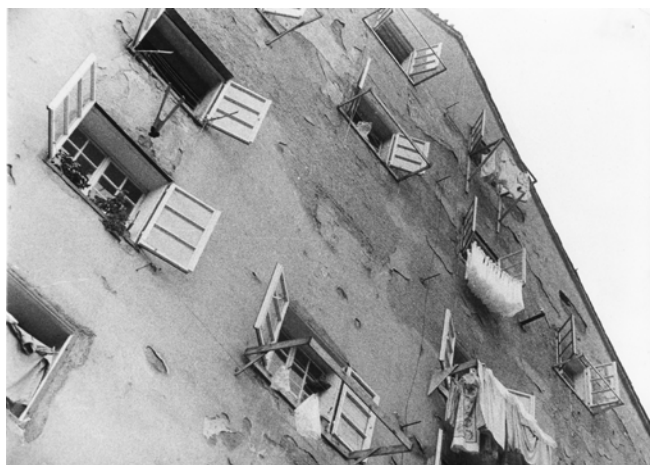
Fotografija iz filma Cukrarna

Avtorski studio Ekran, 1972, 35 mm, črno-beli, zvočni, 13', DCP, scenarista Metka Vajgl, Matjaž Zajec, režiser Jože Pogačnik, snemalec Slavko Nemeč, skladatelj Jure Pengov