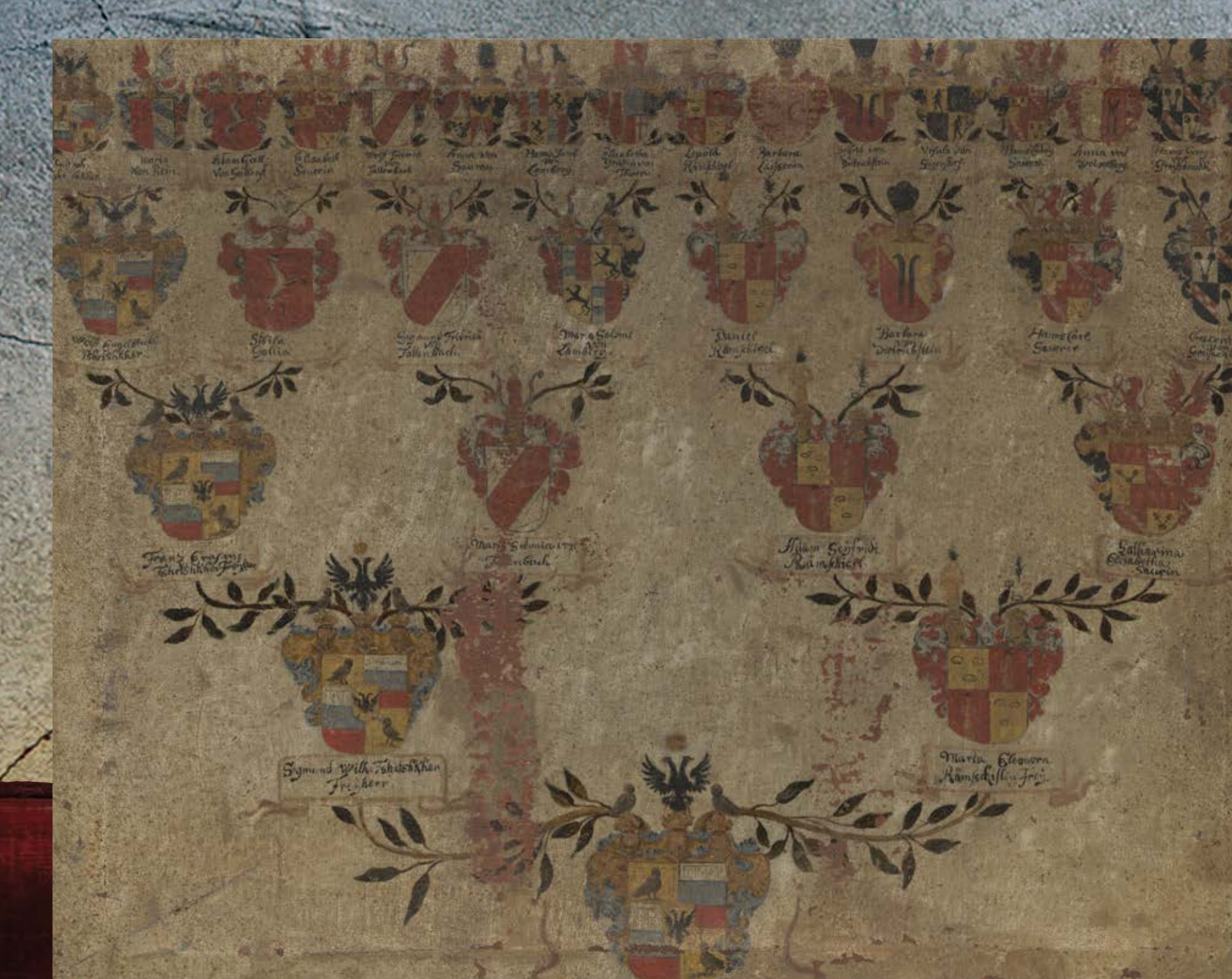
Rodovnik bratov Franca Sigmunda in Adama Sajfrida baronov Zetschkerjev z začetka 18. stoletja (ARS, SI AS 1075/269)

1676 december 14., Passau Orig. perg. (25,5 x 31,5 cm), libel (14 listov), platnice v rdečem žametu s štirimi rdečimi platnenimi trakovi, barvni grb, nemščina, okrogel viseči pečat cesarja Leopolda I., pritrjen z zlato pleteno svileni vrstico (odpadel), signatura: ARS, SI AS 1064/118 Kvadriran ščit s srčnim ščitom; 1. in 4. v zlatem polju zelen trohrib, na katerem stoji sova v naravnih barvah z zeleno oljčno vejico v krempljih in zlato šestkrako zvezdo vrh glave; 2. in 3. dvakrat deljen ščit, zgoraj srebrn, v sredini moder s tremi zlatimi šestkrakimi zvezdami, spodaj rdeč. V zlatem srčnem ščitu dvoglavi črni orel z zlato krono in razprostrtimi krili. Nad ščitom trije kronani turnirski šlemi z modro-zlatim pregrinjalom. Iz srednje krone raste zelen trohrib, na katerem stoji enak črn orel, kakor v ščitu iz desne in leve krone prav tako rasteta zelena trohriba, na katerih stojita druga proti drugi obrnjeni sovi z oljčno vejico v krempljih in zlato šestkrako zvezdo na glavi.