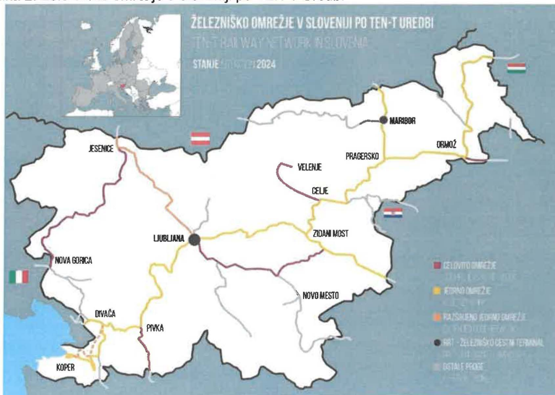
Slika 2: Železniško omrežje v Sloveniji po TEN-T Uredbi