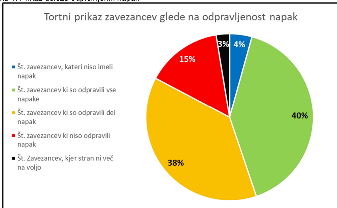
Slika 5: Prikaz deleža zavezancev glede na odpravljenost napak