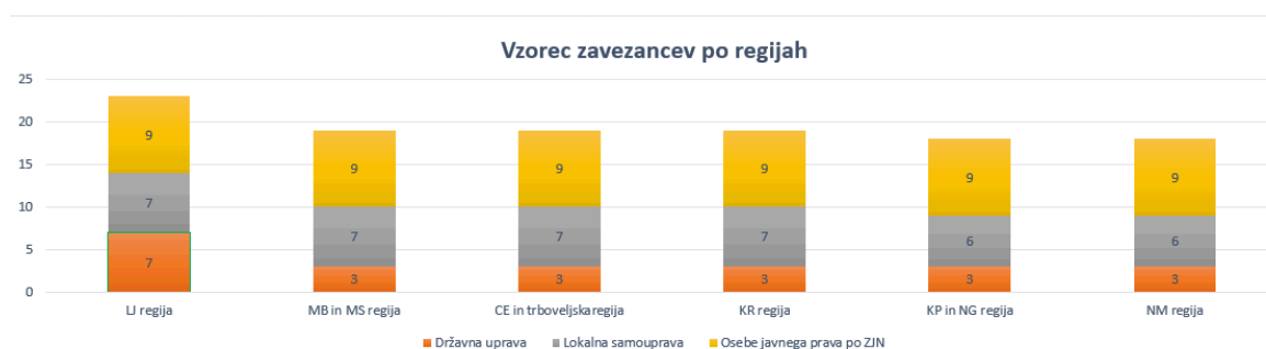
Slika 2: Prikaz izbire vzorca zavezancev po regija

V letu 2021 je Inšpekcija vsled kadrovske podhranjenosti omejila izvedbo poenostavljenega spremljanja spletišč na največ tri ugotovljene napake.