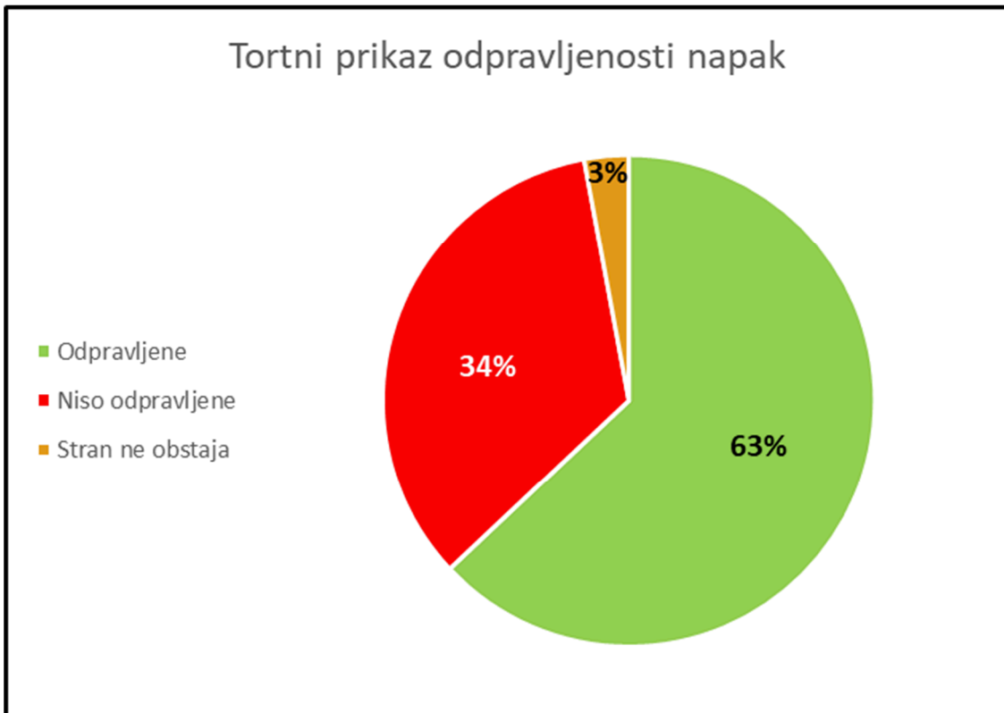
Slika 4: Prikaz deleža odpravljenih napak