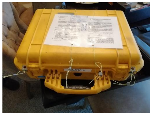
Primer zapečatenne prenosne rentgenske naprave