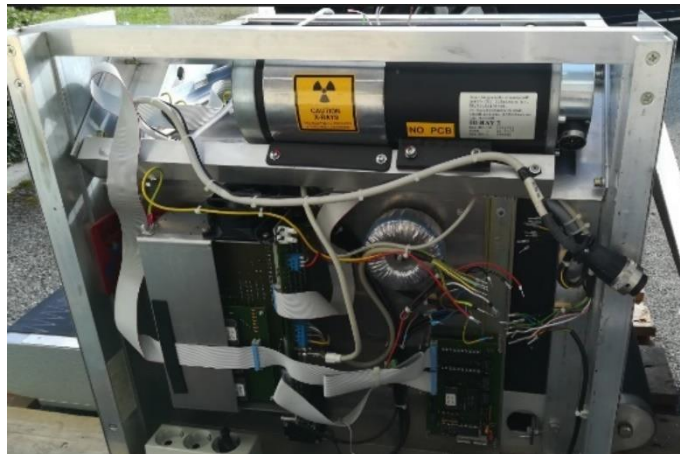
Rentgenska cev tik pred demontažo

Če najdete vir sevanja neznanega izvora ali če sumite, da gre za vir sevanja, pokličite dežurnega URSJV: tel. št. 041 982 713