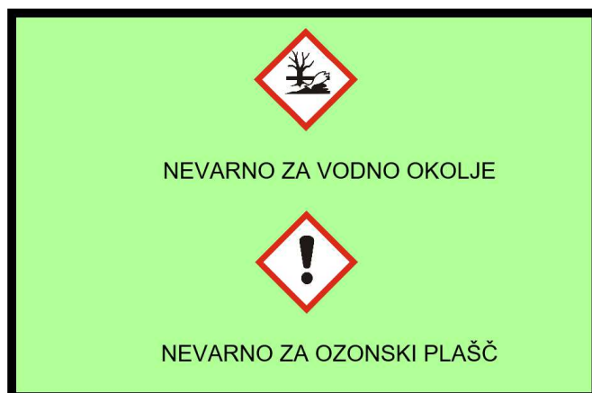
Slika 1: Piktogrami za nevarne lastnosti (Vir: spletna stran Ministrstva za zdravje , citirano: 12.11.2018)