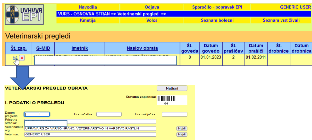
Slika 7: Iskanje zapisnika za vnos podatkov

POZOR: LP se opravlja samo na obratih iz predizbora. Bodite posebej pozorni, da vnašate podatke na pravi zapisnik – vedno preverite GMID pregledanega obrata na tiskanem obrazcu s terena in GMID v aplikaciji EPI! Pred vnosom podatkov na obrazec vedno preberite aktualno OBVEZNO NAVODILO o postopkih izvajanja Pravilnika o izvajanju rednih uradnih veterinarskih pregledov na gospodarstvih!