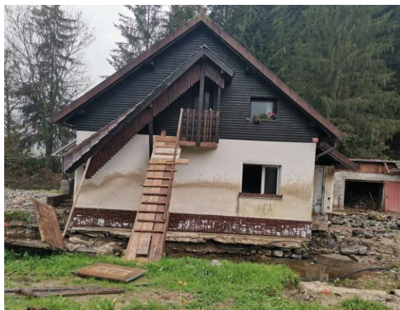
Fotografija 4: fasada in posledice erozijskih procesov