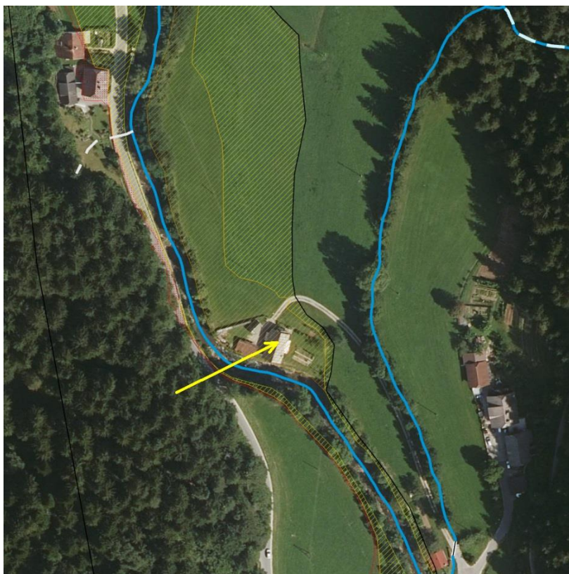
Slika 3: Trenutno veljavna karta razredov poplavne nevarnosti