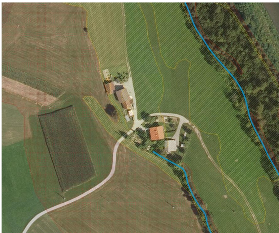
Slika 5: Trenutno veljavna karta razredov poplavne nevarnosti