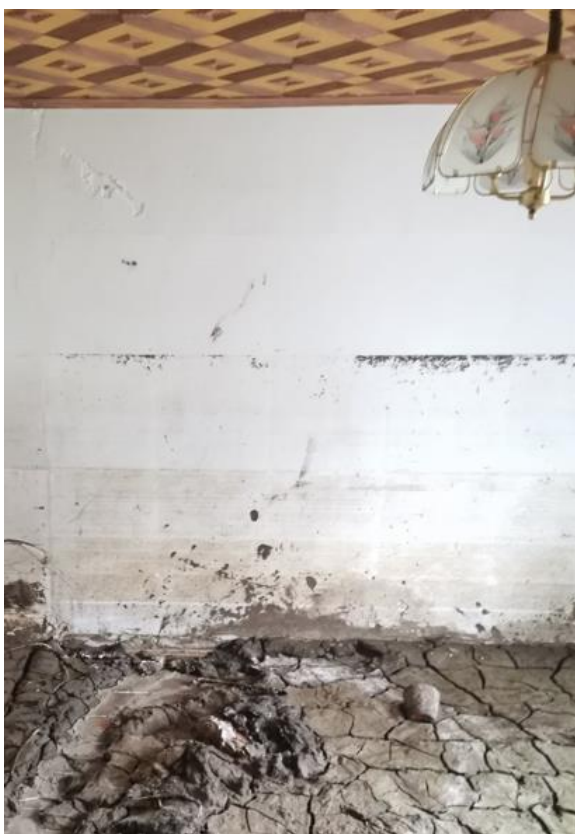
Fotografija 1: mulj v notranjost bivalnih prostorov objekta