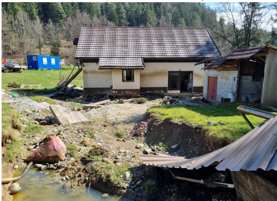
Slika 2: Objekt Ljubija 108

Glede na trenutno veljavne poplavne karte ( Slika 3 ) se objekt nahaja v razredu srednje poplavne nevarnosti, v sklopu cHHŠpS izračuni za to območje niso bili izvedeni.