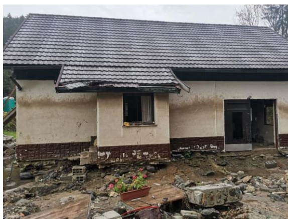
Fotografija 2: fasada z vodno linijo vode