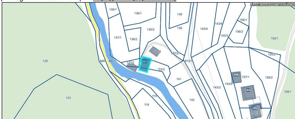
Slika 1: SITUACIJA IN NAVEDBA OBJEKTOV , ki so skladno s STROKOVNIM MNENJEM predlagani za odstranitev