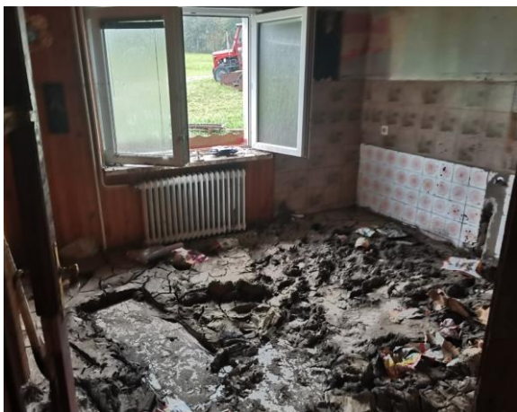
Fotografija 3: notranjost bivalnih prostorov