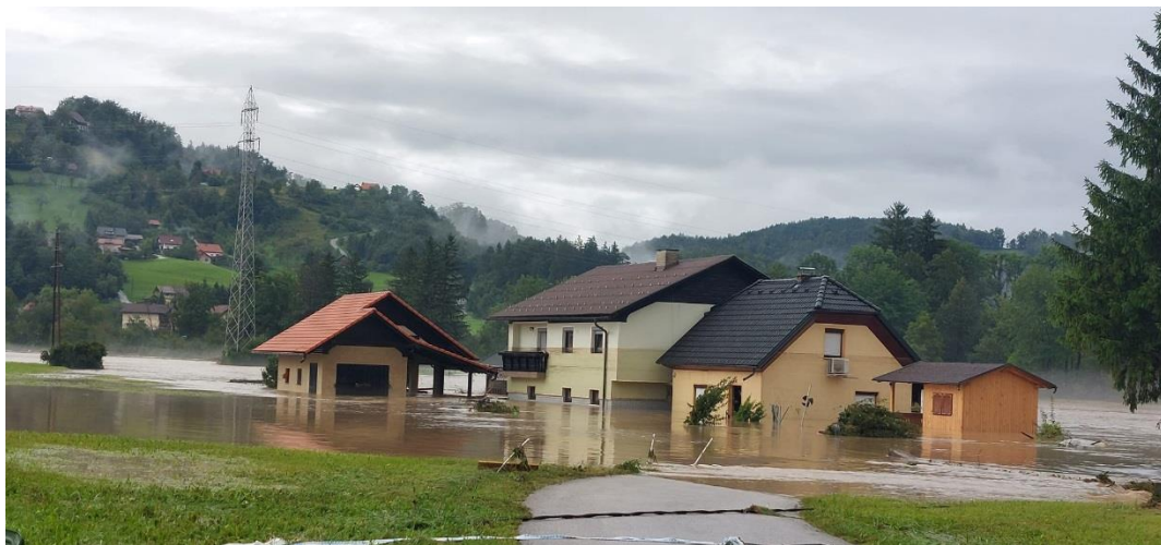
Slika 4: območje objektov Loke pri Mozirju 43, 43A, 47 in 47A

Zaselek 4 objektov Loke pri Mozirju 43, 43A, 47 in 47A se nahaja na skrajnem vzhodnem delu Lok, dobrih 100 m stran od desnega brega Savinje. Obstoječe in novejšje poplavne karte ( Slika 5 in 6 ) na tem območju izkazujeta razred srednje, majhne in preostale poplavne nevarnosti. Ob poplavi 4.8. so se na območju objektov vzpostavile globine toka nad 3.3 m ( Slika 4 ). Območje obravnave je s hidravličnega vidika neugodno, saj se nahaja nad zožitvijo in ostrim S zavojem Savinje (Soteska), kar ob izjemnih pojavih povzroča dodatne lokalne izgube in višje gladine, kot bi bile sicer ob izravnani strugi.