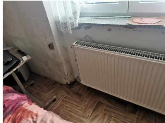
Fotografija 2: Notranjost v spalnici (uničen tlak in stene)