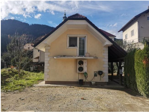
Fotografija 1: Pogled z dvorišča proti V fasadi (fasada očiščena)