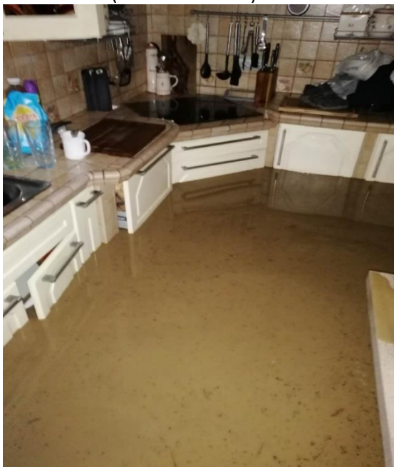
Fotografija 3: Kota vode med poplavami v kuhinji (uničena kuhinja)