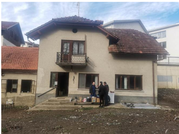
Fotografija 1: Pogled od struge proti južni fasadi hiše z delom kovačije na zahodni strani