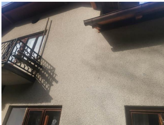
Fotografija 2: S fasada - vidna vertikalna razpoka do strehe