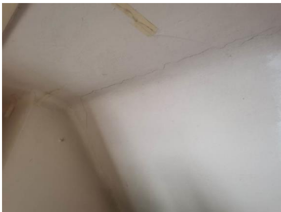
Fotografija 6: Notranjost objekta v mansardi. Nove razpoke in vlaga po celotni strehi