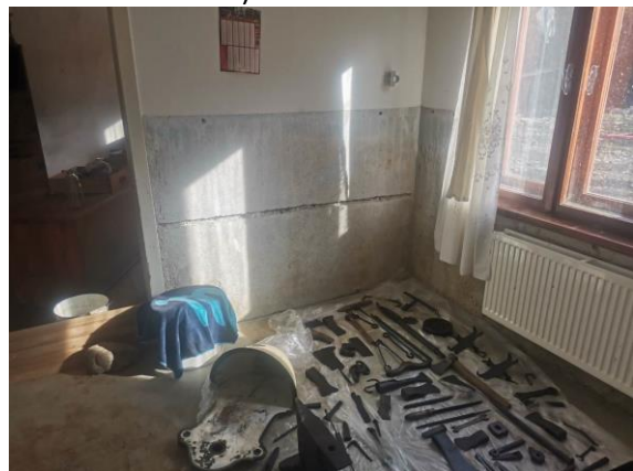
Fotografija 5: Notranjost objekta v pritličju, odstranjen omet z vseh zidov