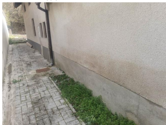
Fotografija 3: Severna fasada proti podpornemu zidu (vidna linija vode)