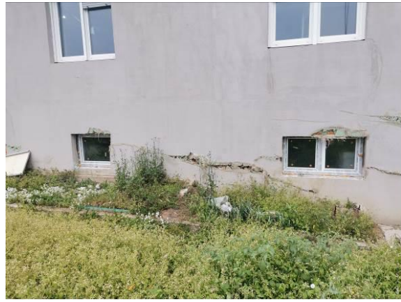
Fotografija 2: Pogled na stanovanjski objekt (jug) poškodovan omet in izolacija