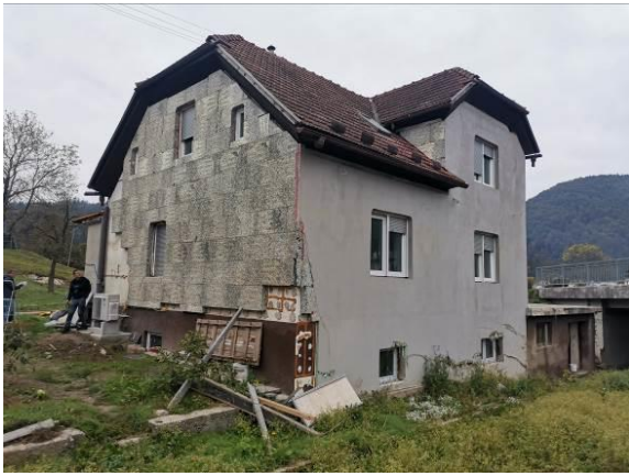
Fotografija 1: Pogled na stanovanjski objekt (jug in vzhod) poškodovan omet in izolacija