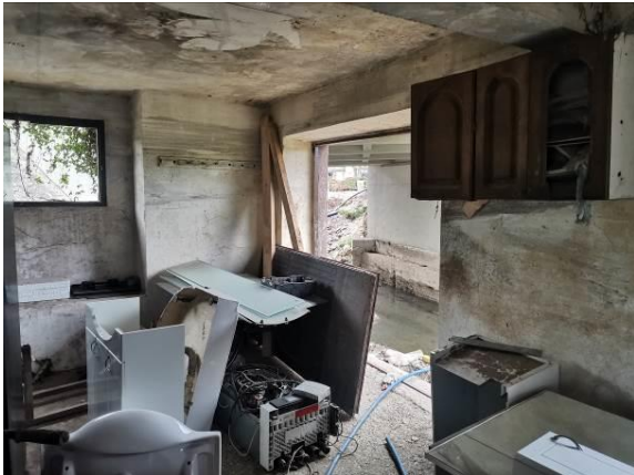
Fotografija 3: Klet - v celoti poplavljen, uničeno stavbno pohištvo