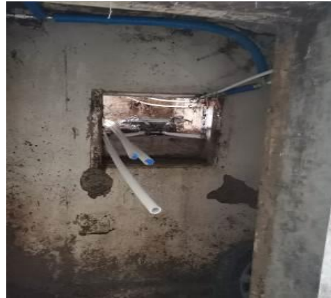
Fotografija 4: Klet – uničeno stavbno pohištvo