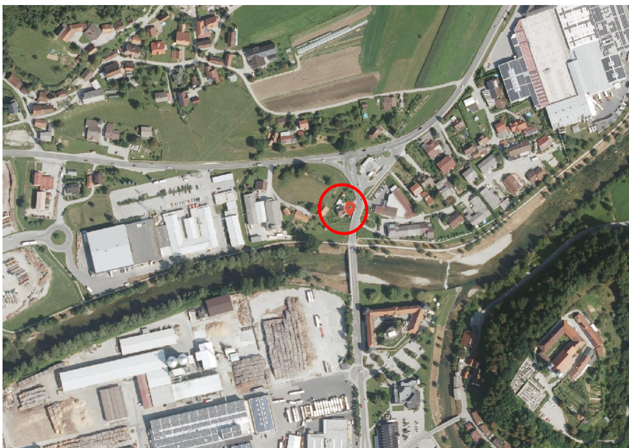
Slika 1: Prikaz lokacije objekta Prihova 40, Nazarje

Na območju občine Nazarje so v prvotno izdanem mnenju dne 14.03.2024 obravnavana tri območja in sicer območje Prihove združeno z območjem BSH, območje Šmartnega ob Dreti in Spodnjih Kraš. Prejeti vlogi sta dodani še dve ločeni vlogi in sicer za objekta Spodnje Kraše 20 (par. št. *145, k.o. Pusto Polje) in Šmartno ob Dreti 53 (parc. št. 164/5, k.o. Šmartno ob Dreti). Predmetni dokument je izvleček izdanega strokovnega mnenja z dne 14.03.2024 in se nanaša na objekt z naslovom Prihova 40. Obravnavana lokacija je prikazana na spodnji sliki.