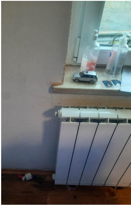
Fotografija 3: Razpoka je vidna tudi na notranji strani stene