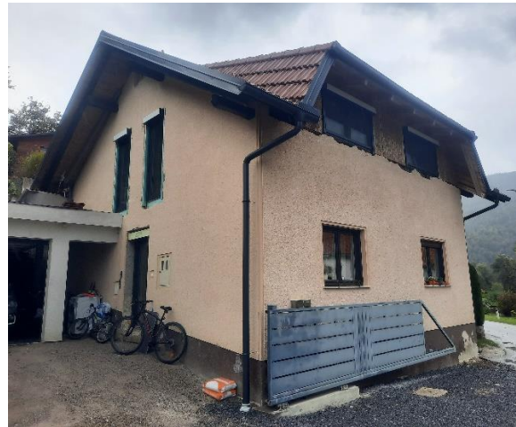
Fotografija 2: Pogled na V vogal objekta