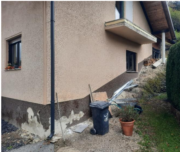
Fotografija 1: Pogled iz J vogal objekta