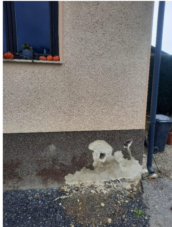
Fotografija 4: Razpoka se iz vogala nadaljuje do okna in še naprej.