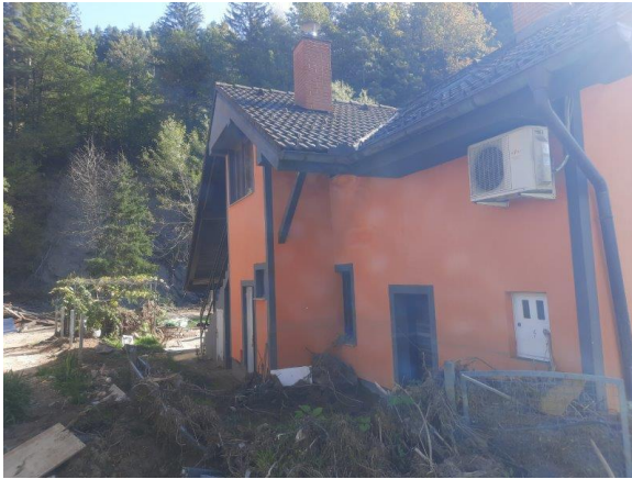
Fotografija 3: Pogled na stanovanjski objekt (jug in vzhod)