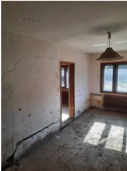
Fotografija 6: Pogled na poškodbe zidu v pritličju objekta