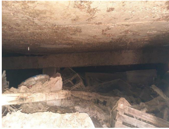
Fotografija 4: Pogled na poškodbe v kletnem delu notranjosti objekta