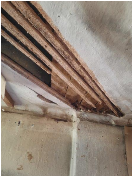
Fotografija 5: Pogled na poškodovan strop v pritličju objekta