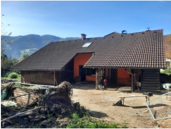
Fotografija 1: Pogled na stanovanjski objekt (zahod)