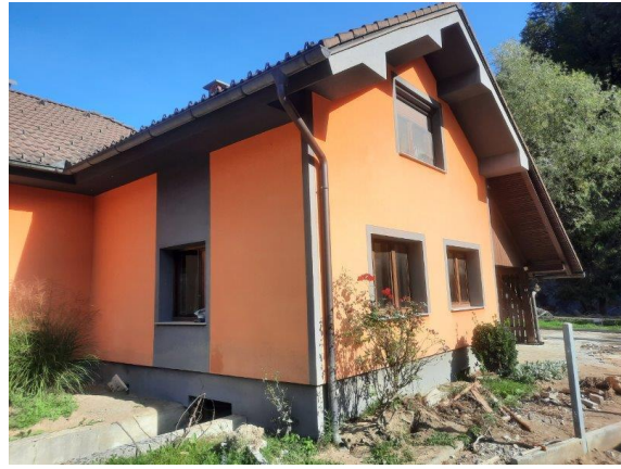
Fotografija 2: Pogled na stanovanjski objekt (sever in vzhod)