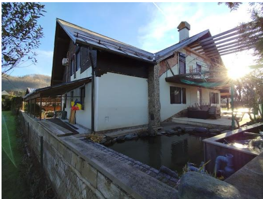
Slika 2 Pogled iz smeri Z