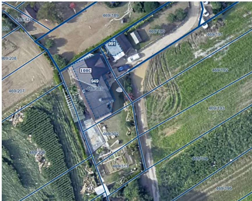
Slika 1 Ortofoto takoj po poplavih avgusta