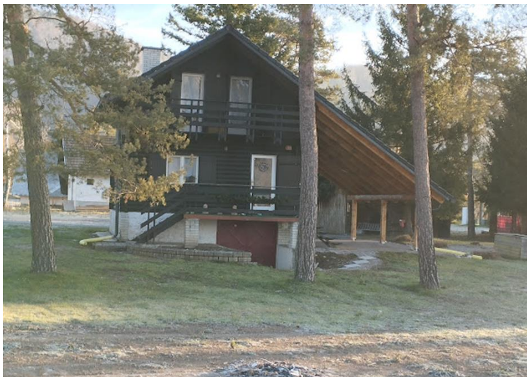
Slika 2: Pogled iz smeri JZ na objekt