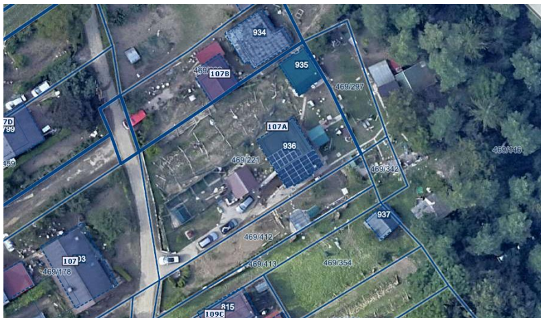
Fotografija 1: Ortofoto takoj po poplavah avgusta