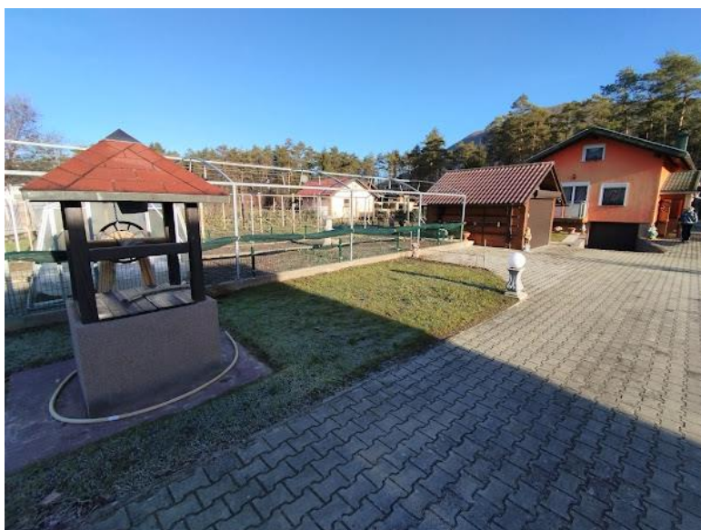
Fotografija 2: Pogled iz smeri JZ