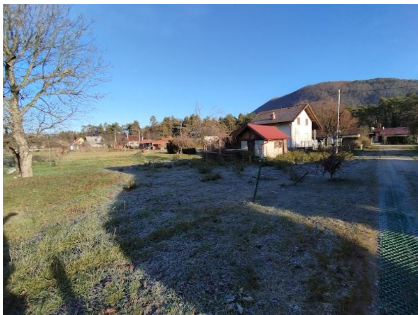
Slika 2 Pogled iz smeri JZ