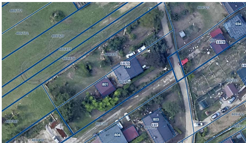
Slika 1 Ortofoto takoj po poplavah avgusta