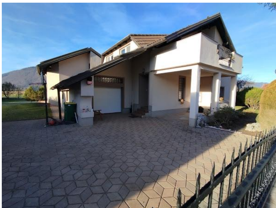
Slika 2 Pogled iz smeri V .. hiša