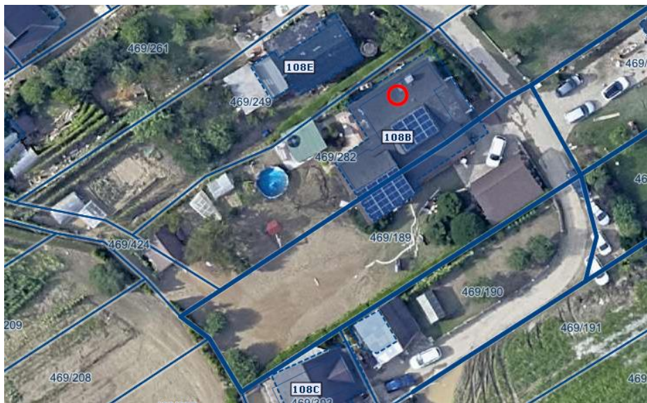
Slika 1 Ortofoto takoj po poplavih avgusta