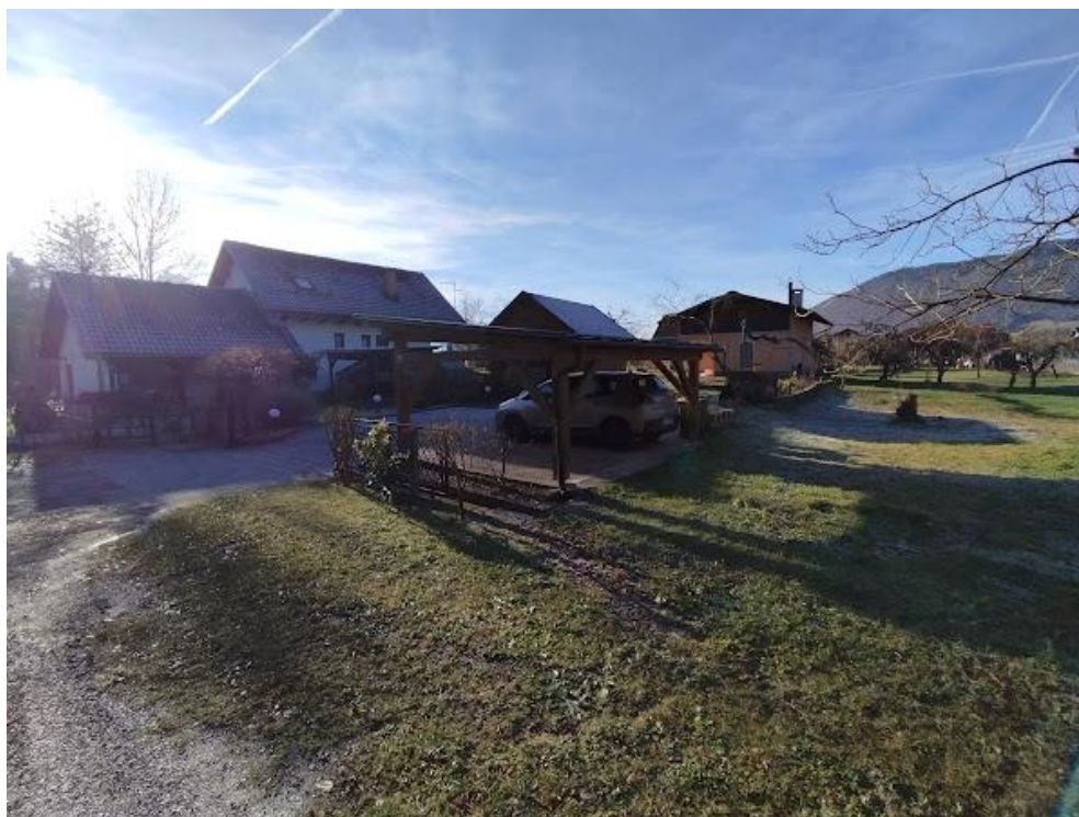
Slika 2 Pogled iz smeri SV