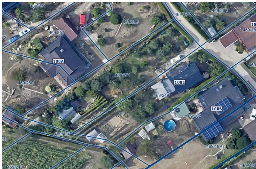
Slika 1 Ortofotografija takoj po poplavi avgusta