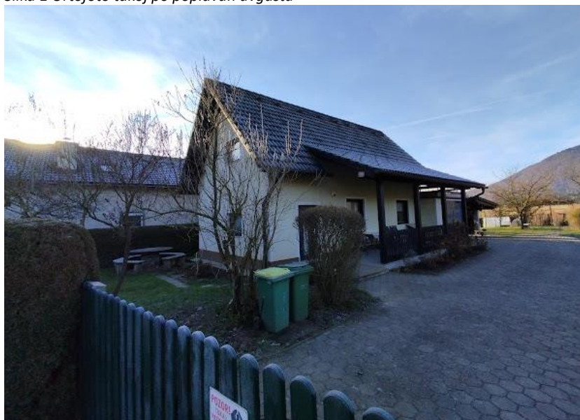
Slika 2 Pogled iz smeri S