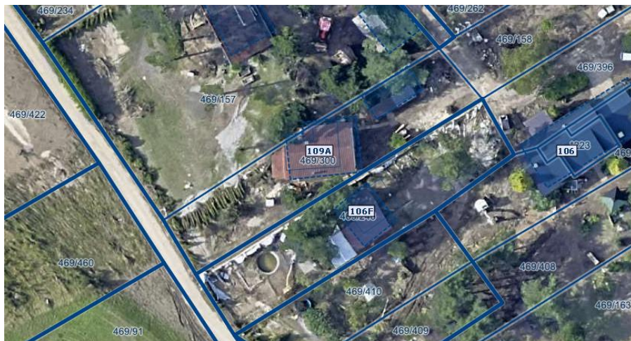
Slika 1 Ortofoto takoj po poplavih