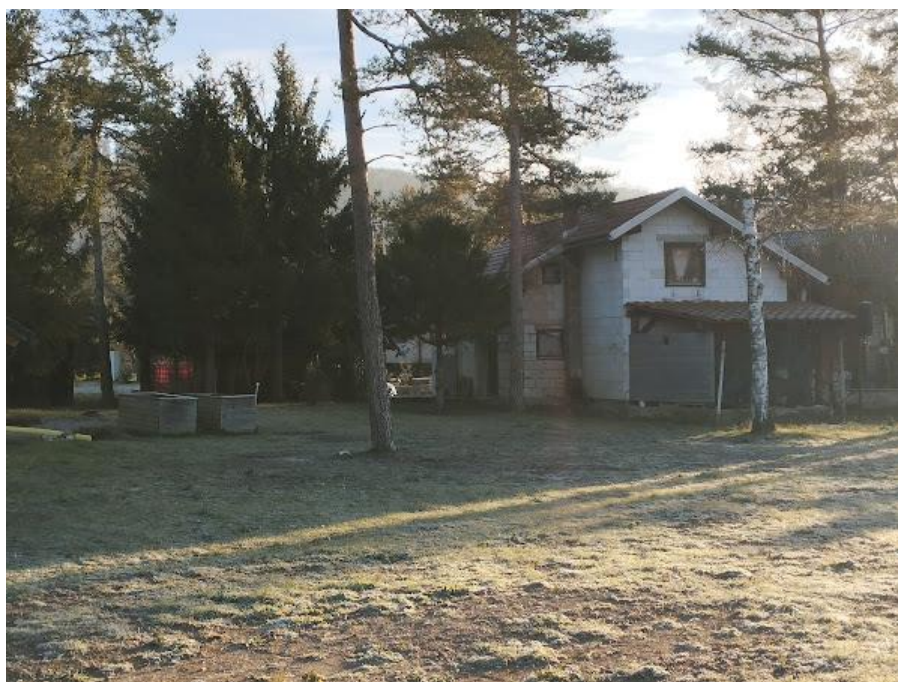
Slika 2 Pogled iz smeri SZ