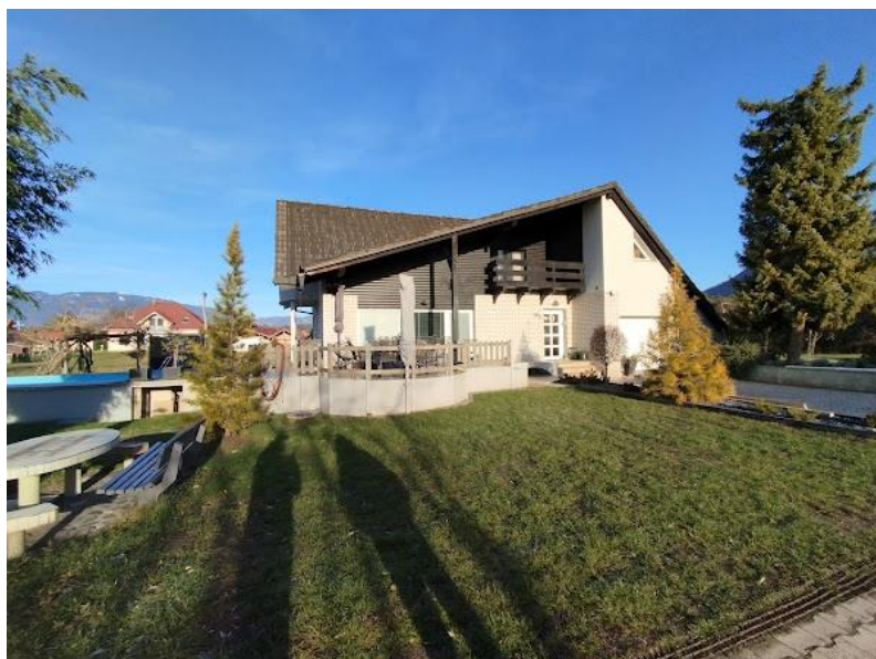
Slika 2 Iz smeri JV