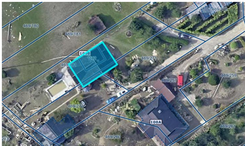
Slika 1 Ortofoto takoj po poplavih avgusta