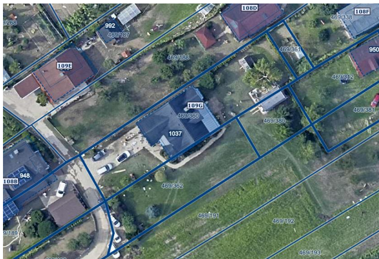
Slika 1 Ortofoto takoj po poplavah avgusta