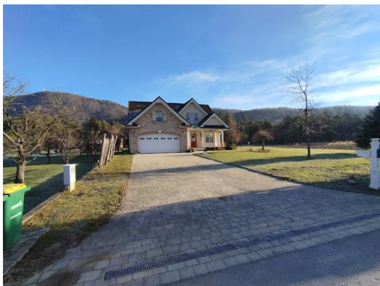
Slika 2 Pogled iz smeri JZ