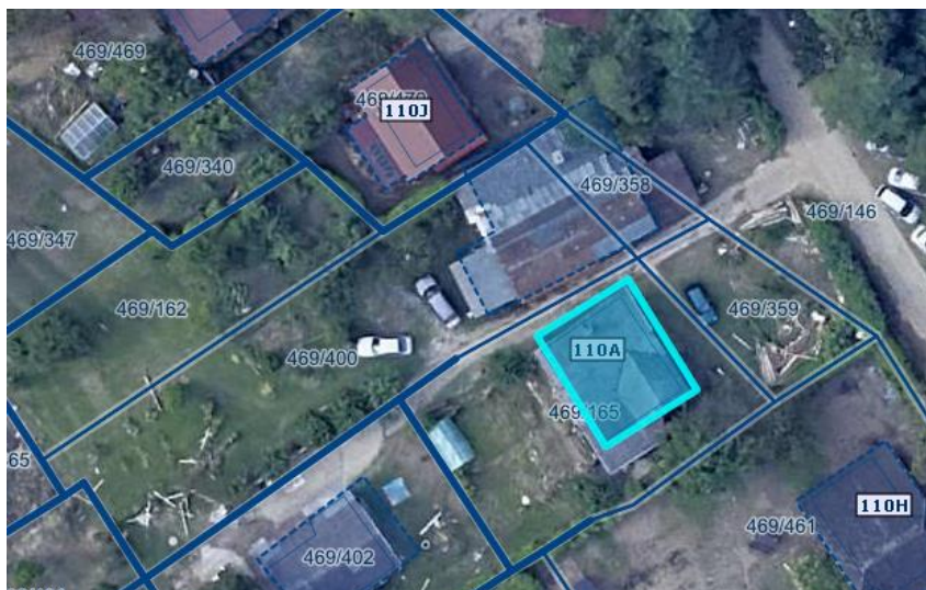
Slika 1 Ortofoto takoj po poplavih avgusta