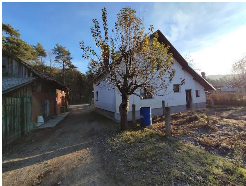
Slika 2 Pogled iz JZ