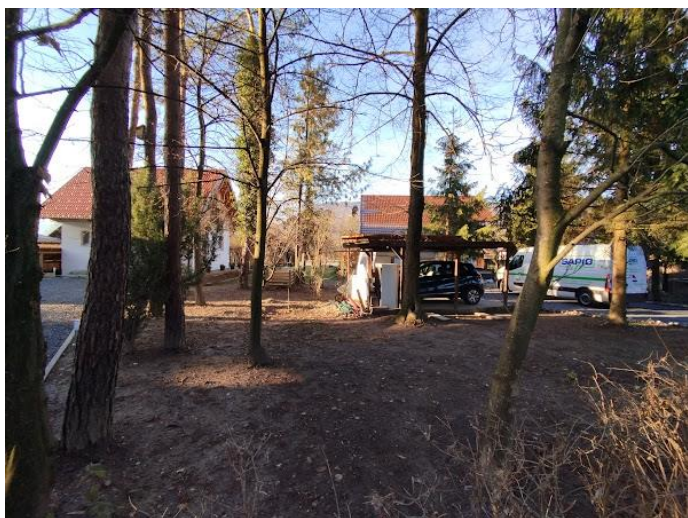
Slika 2 Pogled iz smeri SV