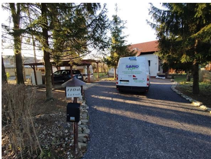
Slika 3 Pogled iz smeri SV