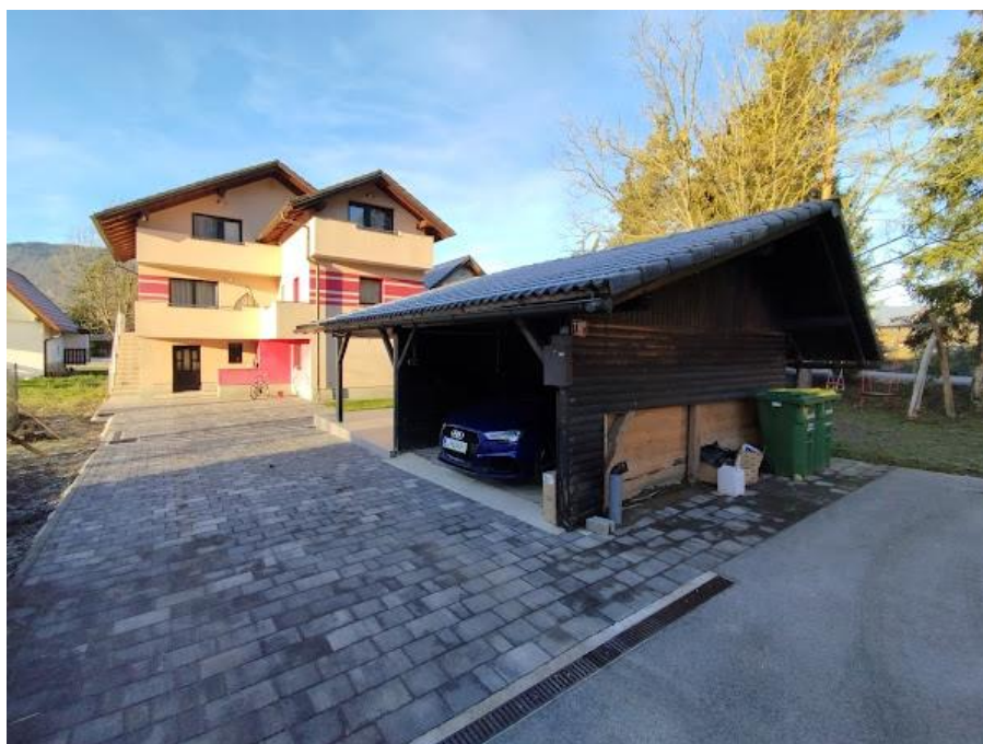
Slika 2 Pogled iz smeri SV