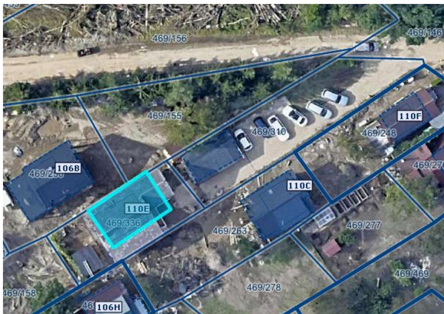
Slika 1 Ortofoto takoj po poplavah avgusta