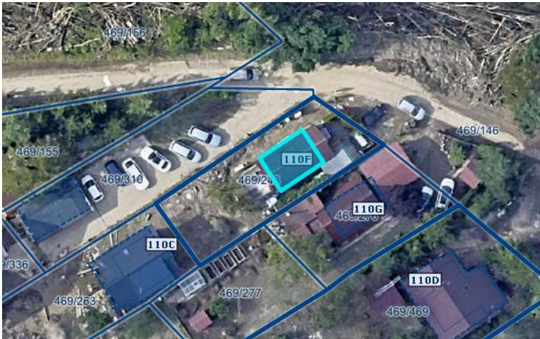
Slika 1 Ortofoto takoj po poplavah avgusta