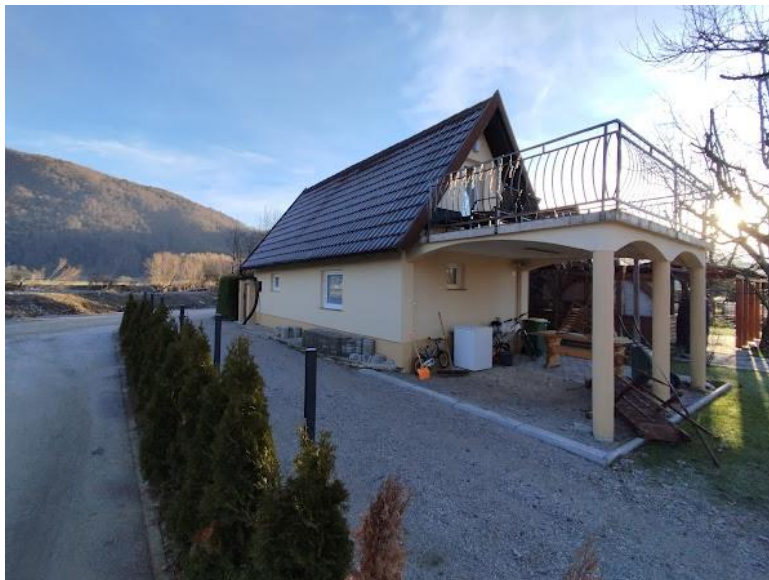
Slika 2 Pogled iz smeri Z