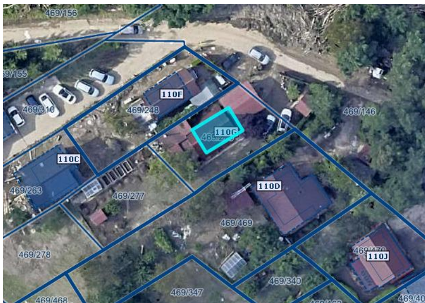
Slika 1 Ortofoto takoj po poplavah avgusta