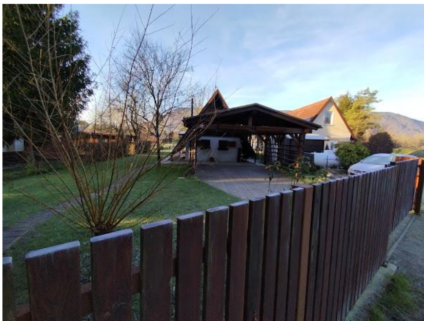
Slika 2 Pogled iz smeri SV