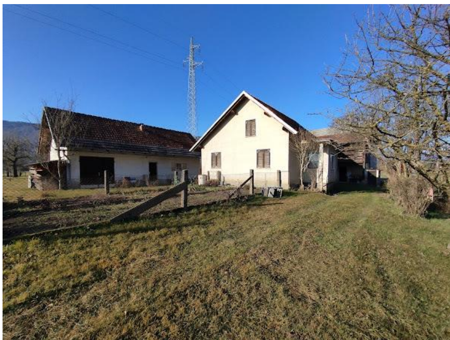
Slika 2 Pogled iz strani V