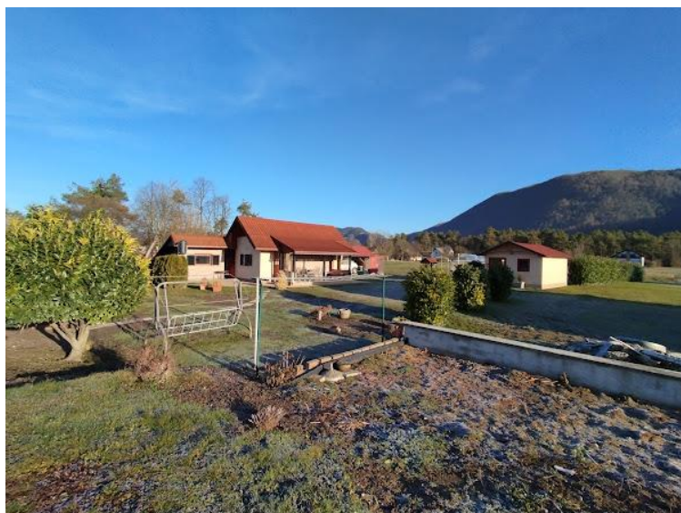
Slika 2 Pogled iz J