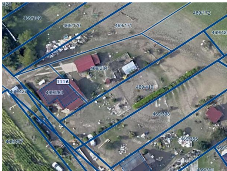
Slika 1 Ortofoto takoj po poplavih avgusta