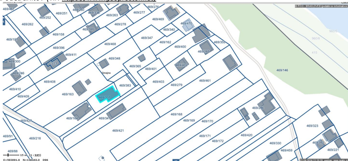
Slika 1: SITUACIJA IN NAVEDBA OBJEKTOV , ki so skladno s STROKOVNIM MNENJEM predlagani za odstranitev

Zaradi teh dejstev predlagamo odstranitev objektov.