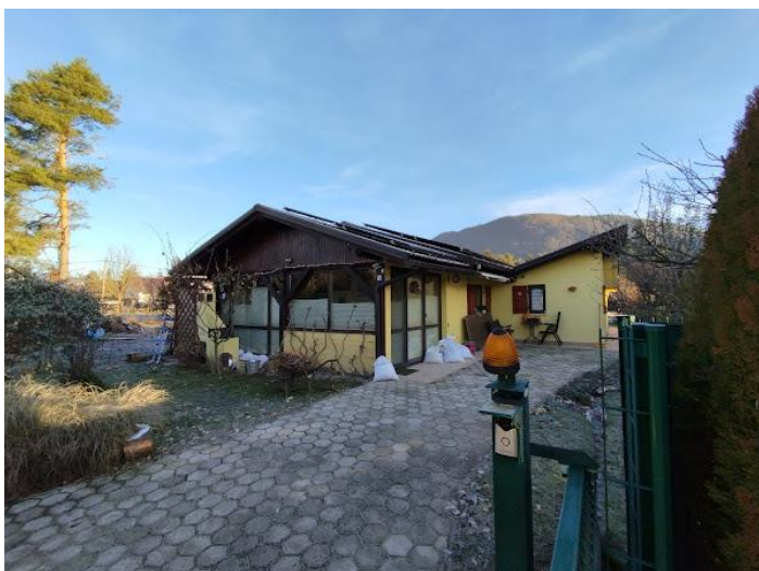
Slika 2 Pogled iz JV