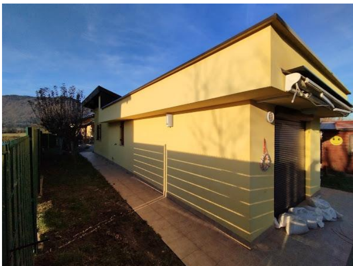
Slika 3 Pogled iz V